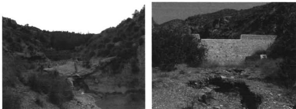
Figura 2. Formas de incisión aguas abajo de los diques (izquierda: Rambla del Cárcavo; derecha: Rambla de la Torrecilla)