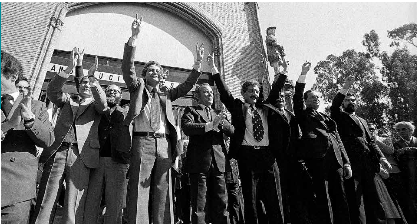
C&T Editores / Centro de Estudios Andaluces.