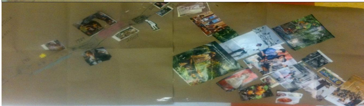
Figura 1.- Comparación de la Línea de vida antes y después del proceso de intervención con arte de la pareja 1.

Nota: Esta pareja si le da forma a su cotidianidad y la representa bajo el simbolismo de un camino, como una manera de expresar su tendencia a ir hacia arriba, buscando crecer, resolviendo lo que se les presenta. Una vez transcurrido el tiempo, no hay vuelta a atrás. Incluso, en su título tratan de remarcar el tiempo que llevan juntos y el área cotidiana de “mantener”, en toda la extensión de la palabra al sistema familia.