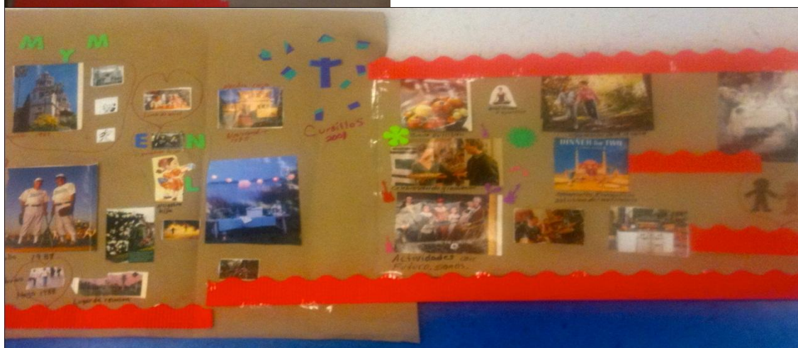
Figura 2.- Comparación de la Línea de vida antes y después del proceso de intervención con arte de la pareja 2.

Esta pareja representa su línea de vida envuelta en lo que para ellos es una cotidianidad, un ambiente de lazos familiares, convivios y festividades, típico de la cultura Latina. La gran influencia familiar y los afectos se viven por medio del contacto social y el cariño que se comparte con quienes son cercanos y significativos; así como la religión también está presente. Las iniciales que se ven, como símbolo que resalta, se plasman de dos maneras las de ellos representadas en la parte superior de todo el arte, en señal de autoridad y figuras parentales y, las de sus hijos, vinculadas al deporte, separadas de ellos, en señal del subgrupo fraternal. No obstante, su reflexión para fortalecer su sistema la han encaminado a tener mayor presencia de Dios en su vida, a recrear más sus convivios como pareja y familia, procurando alimentar la variedad de opciones.