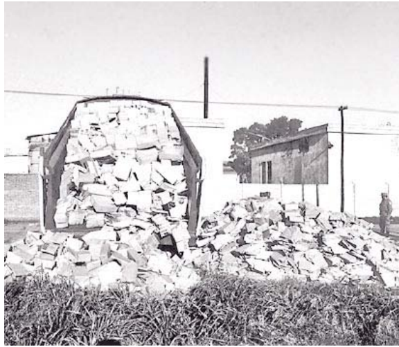
Un camión del ejército descarga libros del Centro Editor de America Latina para quemarlos (Buenos Aires, 1980;)