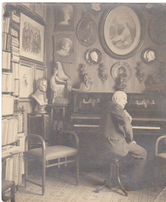
Figura 4. Vicente Peydró ante el piano en el despacho de su domicilio sito en la Calle Músico Peydró nº 6.

Peydró, además, renunció a ir a trabajar a Madrid, por amor a su tierra, Valencia, donde posiblemente hubiese alcanzado mayor fama y reconocimiento, como hicieron sus coetáneos Ruperto Chapí, Vicent Lleó o José Serrano. Esta temática puede suscitar diálogos con el alumnado acerca de los procesos de identidad cultural nacionalista y comprender los procesos de identificación cultural. Se podría hablar de cómo se puede compaginar la identidad local con la identidad estatal buscando una armonía en la identificación a un territorio (ver Figura 4).