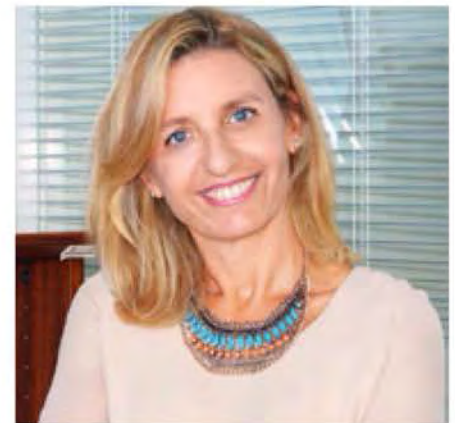
Delegada del Rector para la Igualdad de Género.

También la ONU, con este mismo objetivo, además de incrementar las acciones formativas a edades tempranas, dentro y fuera del sistema educativo, declaró a finales de 2015 el 11 de febrero como Día Internacional de la Mujer y la Niña en la Ciencia, de modo que esta jornada internacional pudiera servir de manera conjunta para visibilizar el trabajo de las investigadoras y para crear referentes para las futuras generaciones de científicas.