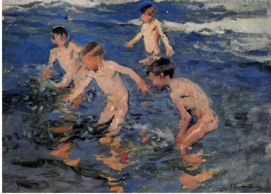
Ilustración 1: Baño de Joaquín Sorolla (Alegría)