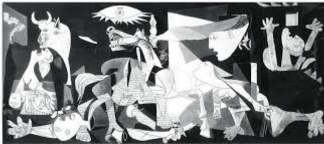
Ilustración 3: El Guernica (Tristeza)