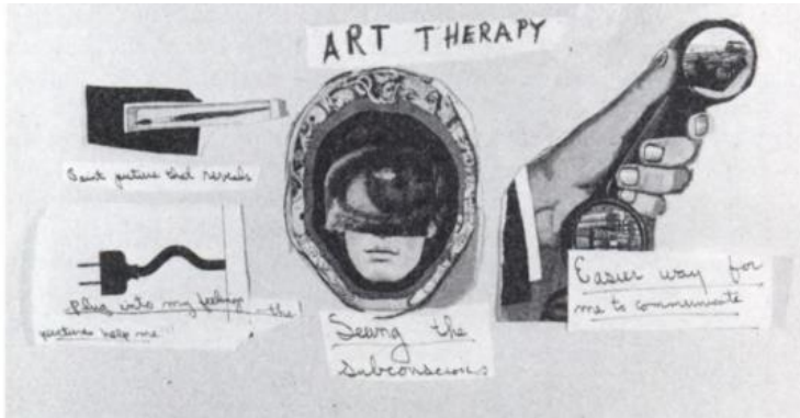
Ilustración 1: Collage Susan Arteterapia.