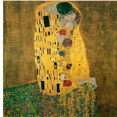
Ilustración 2: El beso de Gustav Klimt (Amor)