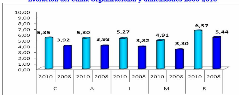
Evolución del Clima Organizacional y dimensiones 2008-2010

Nota: C: Clima Organizacional; A: Clima de Apoyo; I: Clima de Innovación; M: Clima de Orientación a Metas; y R: Clima de Orientación a Reglas.