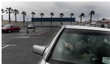
Ilustración 1: Pedro Almetre para Save the Children (2015) "Algunos menas viven dentro de este coche en Ceuta".