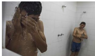
Ilustración 2: Pedro Almetre para Save the Children (2015) "Las manos tapan la cara de este mena que se está duchando en algún sitio público de Melilla".