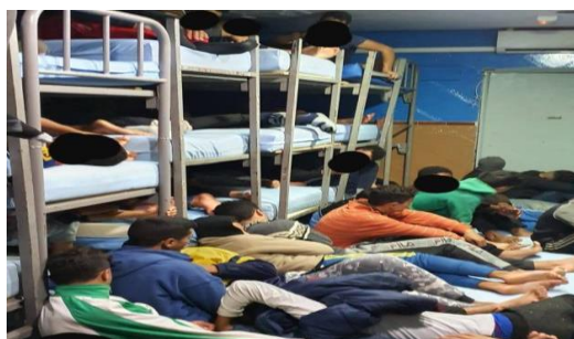
Ilustración 3: El Confidencial. (2019) "Interior del centro melillense "La Purísima".

Recuperado de: https://www.elconfidencial.com/espana/2019-12-31/denuncian-desatencion-menas-melilla_2395416/