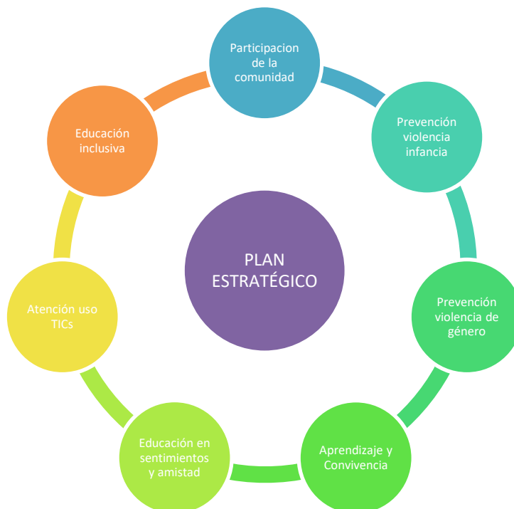
Ilustración 1: Siete ejes Plan Estratégico. Elaboración propia

El Ministerio Educación, Cultura y Deporte (2017) propone un Plan Estratégico de Convivencia Escolar, formado por los siguientes siete ejes , que se trabajarán desde la visión comunitaria, y que implica un adelanto en función de lo que se ha hecho hasta la actualidad en los centros educativos.