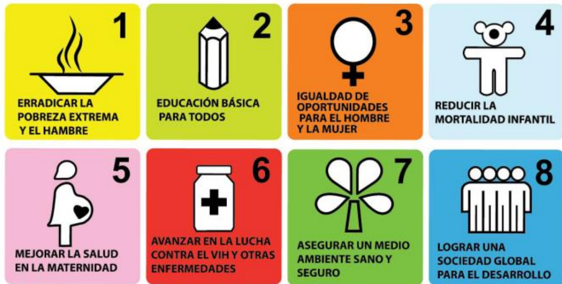
Figura 1: Objetivos de Desarrollo del Milenio.