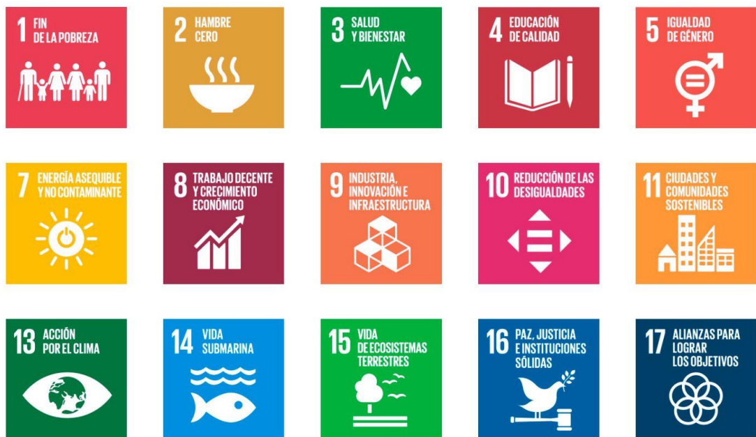
Figura 2: Objetivos de Desarrollo Sostenible.