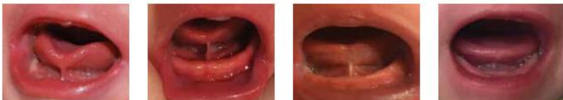
Ilustración 1::Clasificación de Coryllos

Tipo IV: el frenillo no se puede ver, pero se palpa; tiene un anclaje submucoso fibroso y / o grueso y brillante desde la base de la lengua hasta el suelo de la boca.