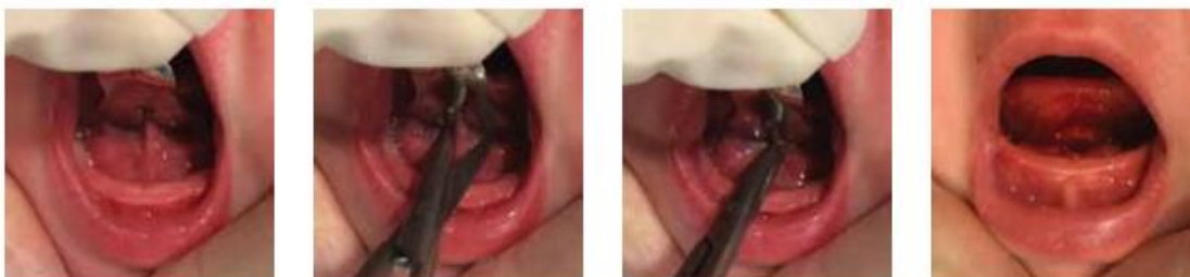
Ilustración 2: Frenectomía (Fuente: Ferrés-Amat et al., 2017)

Otras líneas de tratamiento dependiendo de la complejidad del frenillo son las sesiones de LM con el fin de solventar dudas o dificultades de la LM o la estimulación con terapia miofuncional (Ferrés-Amat et al., 2017).