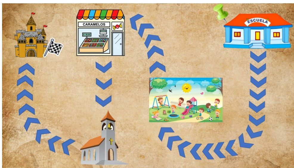
Figura 2: MAPA