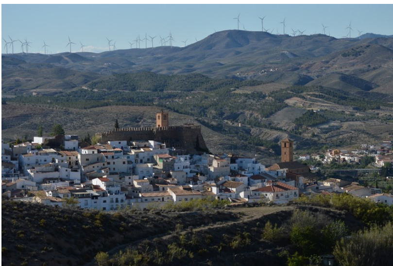
Figura 2: SERÓN