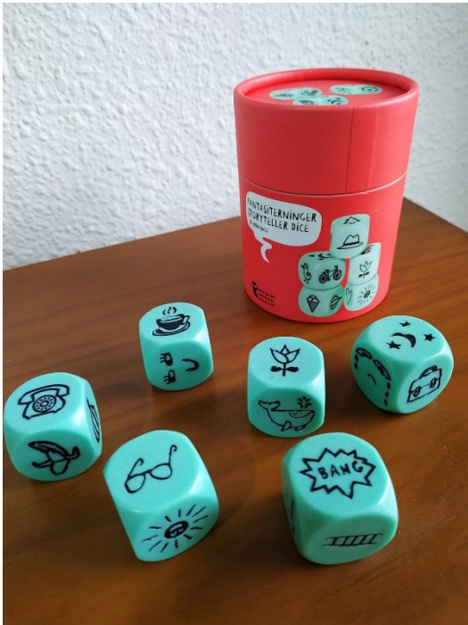
Figura 5: STORY CUBES