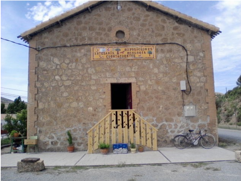
Figura 3: ESTACIÓN DE LOS CUENTOS DE SERÓN