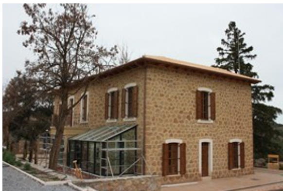
Figura 1: CENTRO DE INTERPRETACIÓN DE LAS MENAS