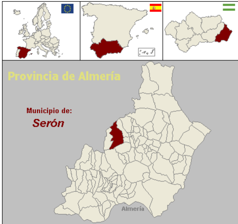
Figura 1: LOCALIZACIÓN GEOGRÁFICA DE SERÓN