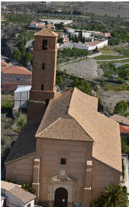
Figura 4: IGLESIA PARROQUIAL NUESTRA SEÑORA DE LA ANUNCIACIÓN