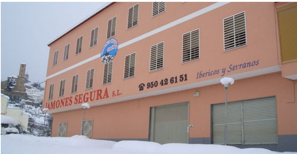
Figura 6: SECADERO DE JAMONES