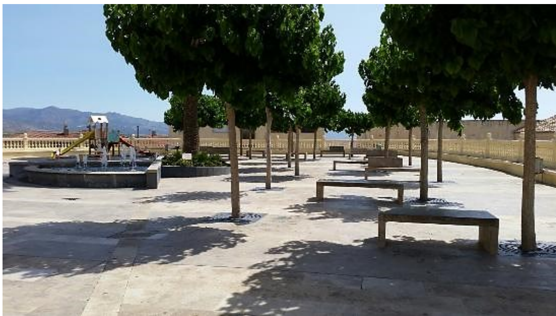
Figura 1: PLAZA NUEVA DE SERÓN