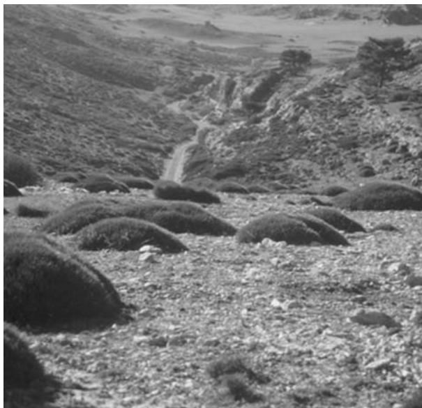
Fotografía 3. Los cojines de monja en las cumbres de Sierra Espuña.