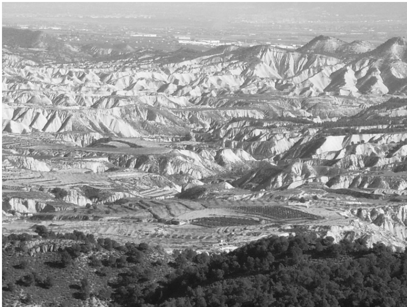
Fotografía 2. Los paisajes de cárcavas en los Barrancos de Gebas.