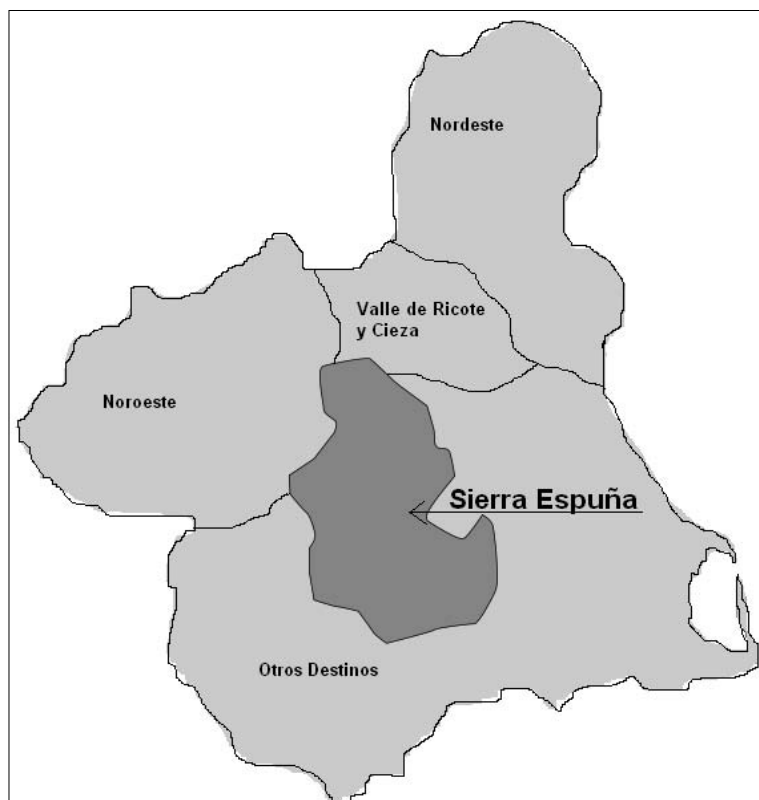
Figura 2. Destinos Turísticos de Interior en la Región de Murcia.