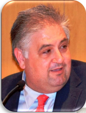
Manuel Alías Cantón Diputado de Hacienda de la Excma. Diputación Provincial de Almería