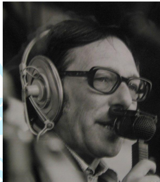
Miguel Ángel Valdivieso, durante una retransmisión deportiva. 12

éxito que fue copiado por las grandes cadenas y que sigue emitiéndose, a pesar de que en la actualidad sufre la dispersión horaria de los partidos.