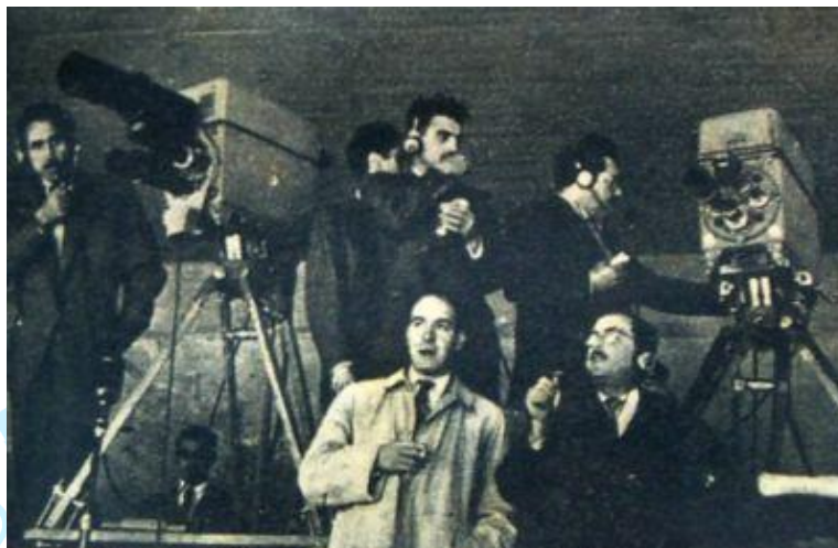
Imagen del primer partido televisado entre el Real Madrid VS Racing de Santander. 14

La crisis. A los clubs de fútbol tampoco les gustó la llegada del nuevo medio de información y ya en 1959 los analistas deportivos hablaban de la necesidad de establecer "unos derechos en concepto de indemnización por perjuicios a terceros". Andando el tiempo se fijó la retransmisión de un partido de Liga cada semana, los domingos a las ocho de la tarde, como colofón a la jornada. Todo este sistema empezó a ser puesto en cuestión con el fin del monopolio de TVE, al aparecer los canales autonómicos y las cadenas privadas. En 1979 se llegó a retransmitir un Sporting-Real Madrid, contra la decisión de los clubs, mediante un decreto del ministerio de Cultura. Más adelante, siguiendo la iniciativa del presidente del Barça Josep Lluís Núñez, los clubs mantuvieron un pulso durísimo con TVE, que dejó sin imágenes la Liga 1984-85, pero acabó con el trato de favor de ciertos equipos.