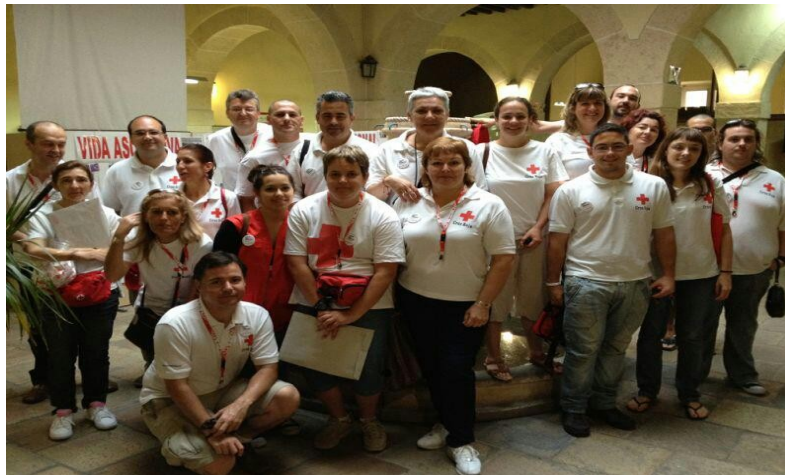
Figura 5: Fotografía grupal del Equipo de venta de lotería.

La esencia de la venta de lotería es conseguir financiación para desarrollar proyectos en CR, por ello, bajo mi punto de vista, estaban tan concienciados/as todas las personas a la hora de vender, que se consiguieron resultados bastante positivos, y así, a más dinero, más ayuda.