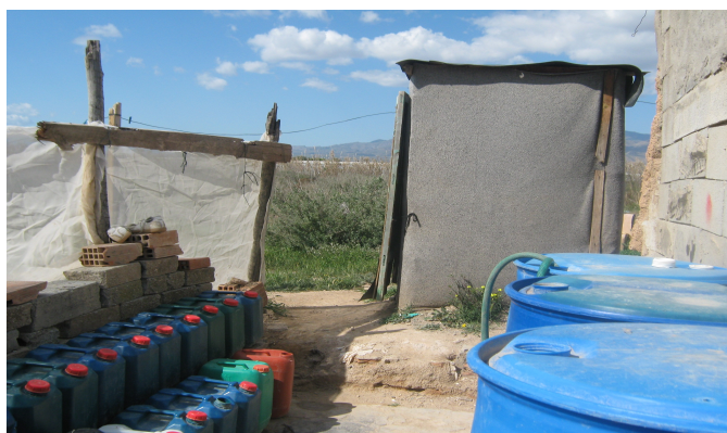
Figura 2: Fotografía de bidones repartidos por CR.

- Bidones: El reparto de bidones responde a la necesidad de tener recipientes para almacenar el agua que, por imposibilidad de ser adquirida en las tiendas embotelladas o en garrafas.