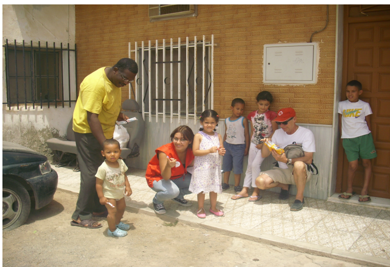
Figura 3: Fotografía del grupo de niños/as asentados/as en Las Norias de Daza.

También están muy bien valoradas y por ende, son muy solicitadas por las familias para divertir y entretener a los/as chicos/as.