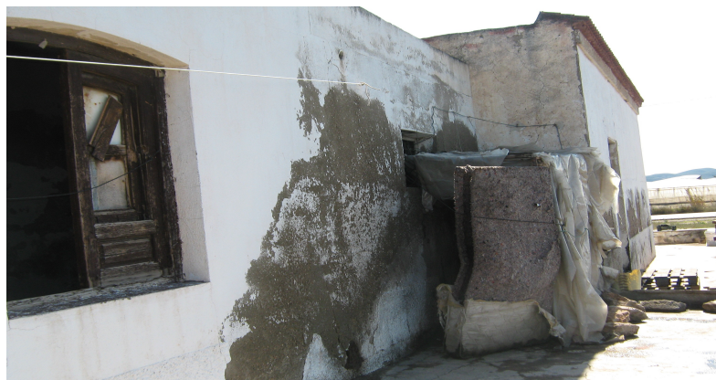
Figura 7: Fotografía del estado de una de las chabolas que visitamos en Níjar.

El reparto de comida, ropa, calzado, bidones, preservativos, etc. es sólo “pan para hoy y hambre para mañana”. Es evidente que de este modo al menos tienen ese “pan para hoy”, pero pensemos de manera objetiva y fría. ¿Adónde van a ir esas personas con tres latas de atún y un paquete de harina si son 5 en la familia y ninguno/a trabaja?