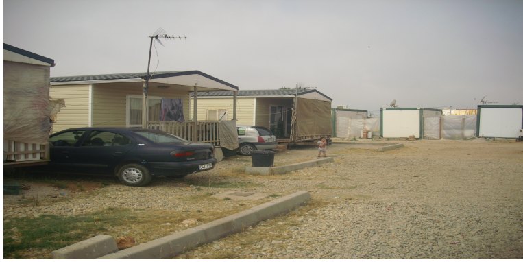
Figura 8: Fotografía de uno de los asentamientos chabolistas en Níjar.

Supongo y espero que a los/as usuarios/as les haya pasado lo mismo conmigo, puesto que yo al inicio era una especie de “nueva”, con reticencias por parte de muchas personas por verme alguien en quien no confiar aún en tanto que desconocida, como antes he dicho, y además alguien muy joven. Pero cuando perciben que sólo quieres ayudarles y tras tratar un rato contigo, ves como se derriban esos prejuicios y se construye una convivencia armoniosa, como podría ocurrir en cualquier ámbito si se aplican estos mismos mecanismos de identificación y tratamiento de prejuicios.