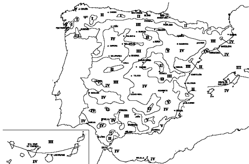
Ilustración 1. Zonas pluviométricas de promedios en función del índice pluviométrico anual.

El grado de impermeabilidad mínimo exigido a las fachadas frente a la penetración de las precipitaciones se determina mediante las siguientes tablas, sabiendo que el terreno es tipo II. Terreno rural llano sin obstáculos de envergadura.