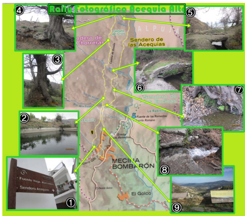
Figura 3. Mapa que llevan los participantes.