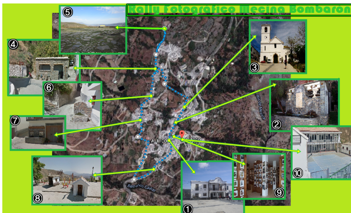
Figura 1: Mapa que llevan los participantes.

La distancia a recorrer es de 2, 2 Km y la duración de 60 minutos aproximadamente.