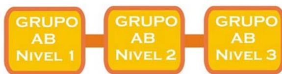
Figura 2.- Situación final. Agrupamientos en 3 niveles.

La distribución del alumnado sería, una vez evaluado previamente a cada uno de los alumnos y alumnas de los dos grupos originales, se procede a la distribución de cada uno de ellos de acuerdo al nivel de competencia que se ajuste mejor al nivel establecido (figura 2). Por lo que quedará repartido dicho alumnado entre tres niveles de competencia, tres grupos de la materia sujeta a nuestro estudio, que responderá a sus necesidades, demandas o carencias.