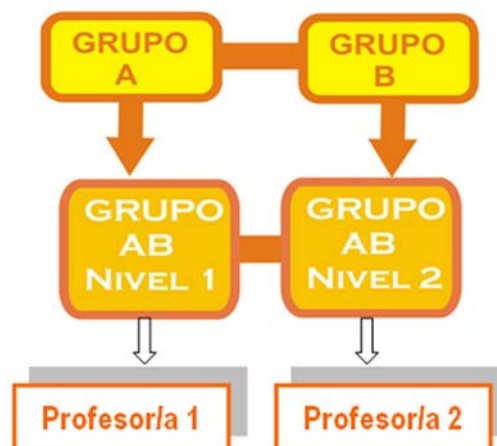
Figura 4.- Vínculo entre dos grupos/dos niveles y profesorado.

En el peor de los casos, se podría dar la situación de flexibilizar los grupos entre sí, obteniendo el mismo número de niveles, bastando para ello los profesores al frente de cada uno de los grupos (figura 4). De este modo, no se extrae ningún nivel más, que surgiría como mínimo, al homogeneizar los distintos grupos a flexibilizar.