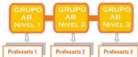
Figura 3.- Vínculo entre dos grupos/tres niveles y profesorado.

Cuando se establecen los niveles se precisará de al menos un docente para cada uno de ellos, y por tanto uno más que grupos se pretendan flexibilizar. Tal y como se refleja en el siguiente esquema (figura 3):