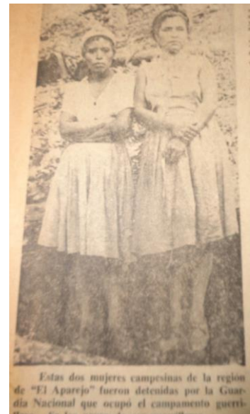
La Prensa , 1 de marzo, 1979