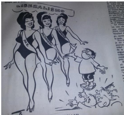
Novedades , 4 de mayo, 1969