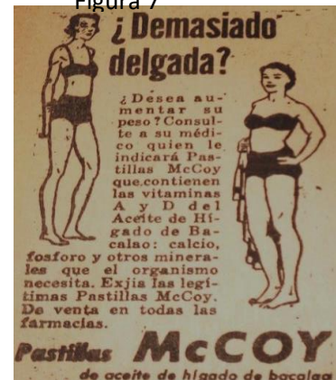
Novedades , enero, 1969