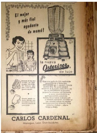
La Prensa , 12 de mayo, 1955