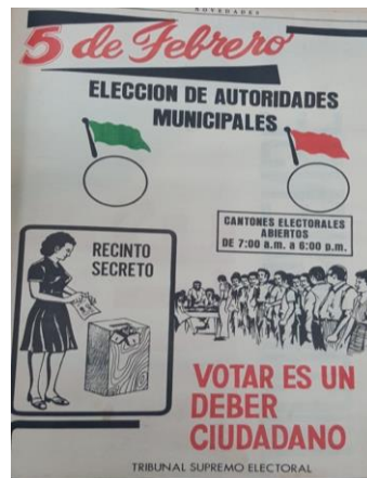
Novedades , 4 de febrero, 1978