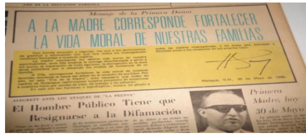
Novedades , 30 de mayo, 1969