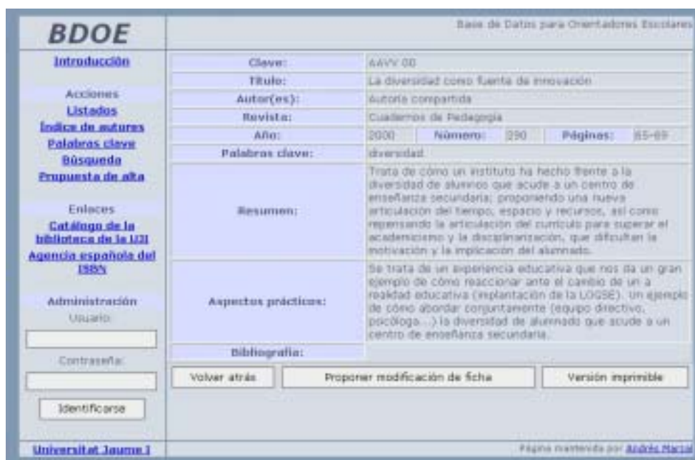
Figura 2. Ficha de uno de los artículos que podemos encontrar en la BDOE.

2. Listados . Muestra un listado de los artículos de la base de datos. Estos pueden aparecer ordenados de acuerdo con los siguientes criterios: Clave (compuesta por el primer apellido del autor del artículo y las dos últimas cifras de su año de publicación), Título del artículo, Autor, Revista y Año de edición. Para elegir o cambiar la forma de ordenación, el usuario sólo tiene que pinchar con el ratón sobre el nombre de la columna deseada. Por otra parte, si pincha sobre la Clave de cada uno de los artículos que aparecen en los listados, se puede acceder a una ficha completa con la información del artículo (ver figura 2). Desde esta ficha, además de visualizar en pantalla la información sobre el artículo, entre la que se inserta un pequeño resumen del mismo, podemos proponer la modificación de la ficha (modificación que siempre estará condicionada al visto bueno del administrador del sistema) y acceder a su “Versión imprimible”.