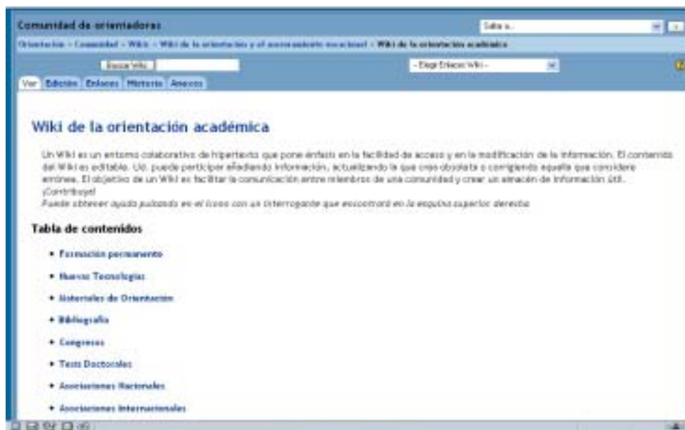
Figura 7. Página inicial del WIKI (accediendo como usuario registrado).

Sólo con pulsar con nuestro ratón sobre el enlace del WIKI en el menú Actividades sociales (ver figura 6), accederemos a su página web inicial. En ella, tanto si accedemos como invitados como si lo hacemos identificándonos con nuestra contraseña, encontraremos en la parte superior algunos apartados propios de la “COMUNIDAD DE ORIENTADORES”, como el desplegable “Saltar a...” y los enlaces a la jerarquía web de los que depende la página.