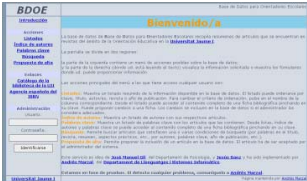
Figura 1. Página inicial de la BDOE.

El menú de acciones consta de apartados de uso público : Introducción, Listados, Índice de autores, Palabras clave, Búsqueda y Propuesta de alta; junto a otro de acceso restringido , reservado al administrador del sistema (sólo a través de clave de acceso): Administración.