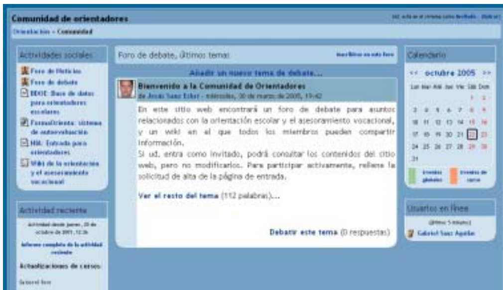
Figura 6. Captura parcial de la Página inicial de la Comunidad de Orientadores.

La pantalla inicial de la COMUNIDAD DE ORIENTADORES presentará un aspecto similar para el usuario invitado y el miembro de pleno derecho, pero el usuario registrado contará con algunas opciones más como las de editar su propios datos o información personal, cambiar su contraseña y darse de baja como usuario registrado.