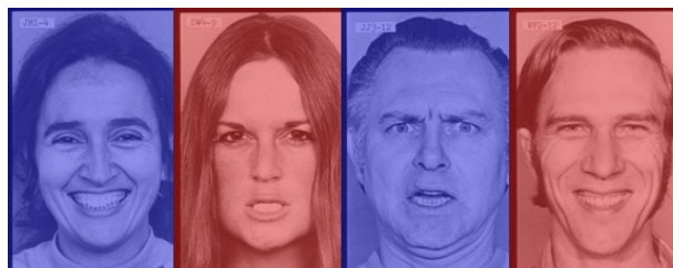
Figura 1. Muestra de fotografías tintadas usadas. De izquierda a derecha: mujer 1 con expresión de alegría y coloreada de azul, mujer 2 con expresión de enfado en rojo, hombre 1 con expresión de enfado en azul y hombre 2 con expresión de alegría en rojo.

Los materiales fueron presentados en un portátil Asus X552C con una pantalla de 16 pulgadas y un procesador Intel Core i3-3217U CPU de 1.80GHz y 4,00GB de memoria RAM. La temporización y presentación de los estímulos fueron controladas mediante el software E-Prime versión 2.0 professional (Schneider, Eschman & Zuccolotto, 2002), que también permitió el registro de las respuestas de las participantes.