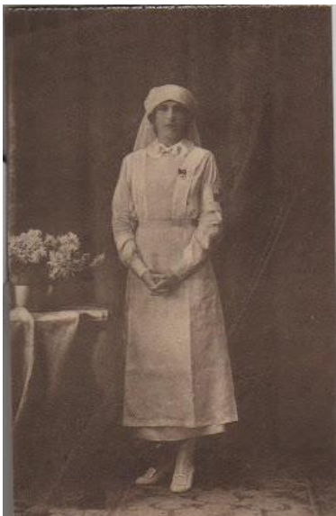
Imagen 9: Victoria Eugenia Reina de España con el uniforme de la Cruz Roja. Fotografía monocolor obra de Marcelino Santamaría. En la instantánea se aprecia a la reina posando con el uniforme de la Cruz Roja con actitud de recato. El impoluto uniforme cubre cada centímetro corporal desde el cuello hasta los talones. Las manos entrelazadas nos transportan a la pose de oración. La cabeza ladeada y el gesto serio sin atisbo de desentono moral. El uniforme cubre cada centímetro corporal desde el cuello hasta los talones. (Expósito, 2010)

sujeto activo mientras que el conjunto de enfermeras es representado como un grupo de sujetos pasivos. Se muestran ligeramente cabizbajas mientras que la postura del médico sugiere poder y firmeza. Es la composición más habitual a la hora de representar la relación de poder entre mujer enfermera-médico varón. Ya no sorprende la proporción numérica entre médicos y enfermeras en las fotografías de la época. Un único médico se rodea de al menos media docena de enfermeras. Esto denota cierta intencionalidad a la hora de representar la dominación masculina sobre el máximo número de mujeres posible, no se observarán imágenes de la época en proporción 1:1 para que no se llegue a considerar la igualdad profesional. (Sellán, Vázquez, & Blanco, 2010)