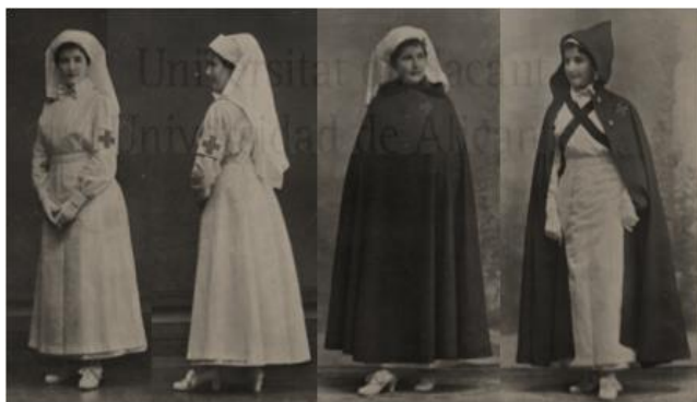
Imagen5: Uniforme reglamentario Damas enfermeras (1917): Fusión de 4 instantáneas monocromáticas del uniforme completo de las Damas enfermeras de la Cruz Roja española. Este primer uniforme cubría completamente el cuerpo de la

Correos de España con el retrato del Dr. Rubio y Galí, fundador de la primera escuela de enfermeras. A su lado se observa a dos enfermeras admirando con una sonrisa discreta a un neonato. De nuevo se representa el conjunto sin incidir en la individualidad de cada enfermera. Son un grupo homogéneo sin rasgos identitarios propios. (Expósito, 2010)