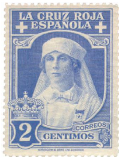
Imagen 11: Sello conmemorativo de la Cruz Roja española en color azul emitido en 1926.

las manos ni bajar el mentón. No obstante, sigue manteniéndose presente el aspecto pulcro y sobrio correspondiente a la imagen de las enfermeras. (Expósito, 2010)