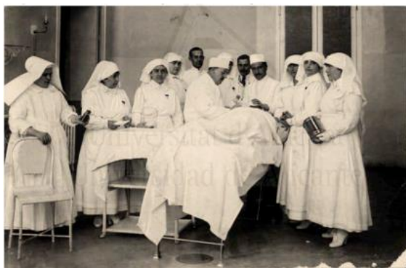
Imagen 7: Prácticas de Damas Enfermeras en el Hospital de Carabanchel (1918).

Damas francesas. La imagen revela la escena típica del médico varón rodeado de enfermeras en posición atenta y servicial. De nuevo se observa el “harén” profesional del médico que se rodea de mujeres a su servicio. Destaca la habitual presencia de una mujer religiosa entre las enfermeras como si mantener la rectitud moral fuese su misión. (Mas, 2016)