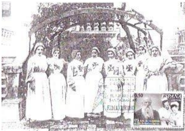
Imagen 4: Conjunto de imágenes postales de enfermería. Tarjeta en blanco y negro que muestra a las Enfermeras de Santa Isabel de Hungría. Las enfermeras posan con una actitud comedida y recatada portando el uniforme completo de la escuela. A la tarjeta se le ha acoplado un sello de

Correos de España con el retrato del Dr. Rubio y Galí, fundador de la primera escuela de enfermeras. A su lado se observa a dos enfermeras admirando con una sonrisa discreta a un neonato. De nuevo se representa el conjunto sin incidir en la individualidad de cada enfermera. Son un grupo homogéneo sin rasgos identitarios propios. (Expósito, 2010)