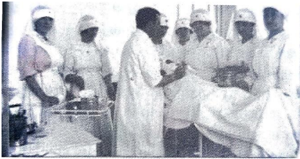
Imagen 8: Conjunto de enfermeras atendiendo a la lección. Fotografía en blanco y negro. Un grupo de enfermeras completamente uniformadas atiende a las explicaciones del médico en una actitud expectante. El médico se muestra como

sujeto activo mientras que el conjunto de enfermeras es representado como un grupo de sujetos pasivos. Se muestran ligeramente cabizbajas mientras que la postura del médico sugiere poder y firmeza. Es la composición más habitual a la hora de representar la relación de poder entre mujer enfermera-médico varón. Ya no sorprende la proporción numérica entre médicos y enfermeras en las fotografías de la época. Un único médico se rodea de al menos media docena de enfermeras. Esto denota cierta intencionalidad a la hora de representar la dominación masculina sobre el máximo número de mujeres posible, no se observarán imágenes de la época en proporción 1:1 para que no se llegue a considerar la igualdad profesional. (Sellán, Vázquez, & Blanco, 2010)