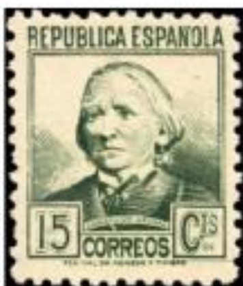
Imagen 1: Sello en color gris pizarra con valor de 15 céntimos emitido en 1935. Representa la efigie de Concepción Arenal enfermera y miembro activo de la Cruz Roja de Madrid entre otras muchas aportaciones. Es considerada la madre del feminismo en España. Fue enfermera durante 5 meses en un hospital de guerra. Llama la atención que Concepción Arenal es representada desaliñada, con un gesto duro y poco femenino acorde a la

concepción de falta de feminidad asociada a las mujeres reivindicativas de la época. (Guerra, 2016).