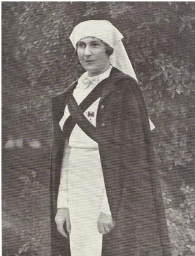
Imagen 10: Reina Victoria Eugenia, con el uniforme de las Damas Enfermeras de la Cruz Roja Española.

(Mundo Gráfico XI 1921). Instantánea en blanco y negro de la Reina Victoria posando con el uniforme completo de las Damas Enfermeras. La reina se retrataría con este atuendo en numerosas ocasiones a fin de impulsar el proyecto de las Damas Enfermeras en nuestro país. La pose de la reina se libera de la tan observada actitud de recato y sumisión típica de las representaciones enfermeras de la época sin entrelazar