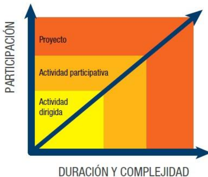
Figura 14: Relación propuesta pedagógica y participación

En el siguiente cuadro se observa la creciente participación de los niños, niñas y jóvenes en función del incremento de la duración y complejidad de las actividades.