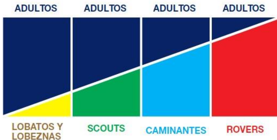
Figura 13: Injerencia de niños, niñas y adolescentes en la toma de decisiones