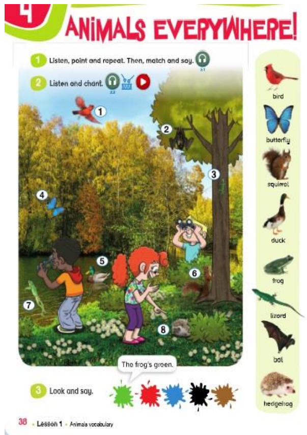
Ilustración 4. Actividad para sesión 2