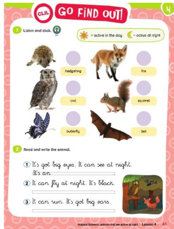
Ilustración 5. Actividad para sesión 5