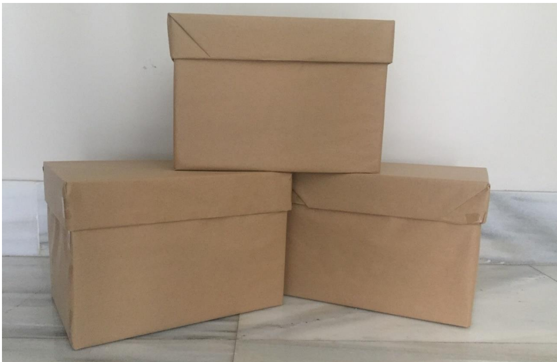
Ilustración 9. Cajas para sesión 6