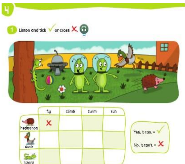
Ilustración 6. Actividad para sesión 4