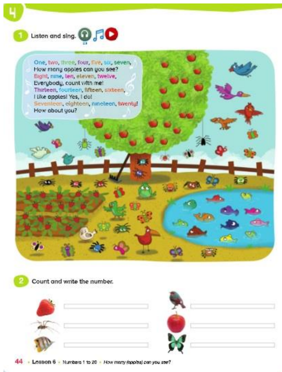
Ilustración 8. Actividad para sesión 6