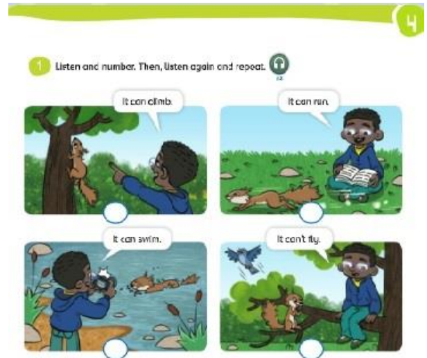
Ilustración 3. Actividad para sesión 3