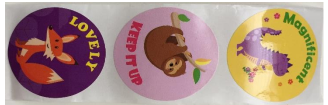
Ilustración 7. Stickers para premios