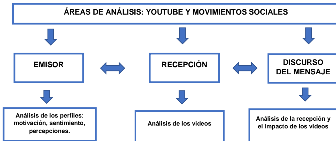
Tabla 1. Áreas de análisis en la metodología.

La propuesta metodológica de este trabajo trata tres áreas fundamentales a la hora de comunicar; las cuales son emisor, mensaje y el receptor.