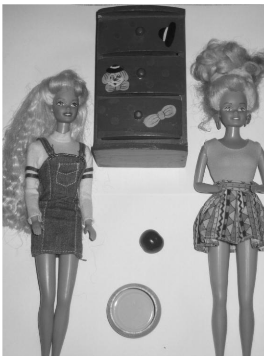
Figura 2. Material Prueba “Anne y Sally”

En esta investigación los materiales utilizados han sido dos muñecas, una cajonera, una lata y una canica (Ver Figura 2).