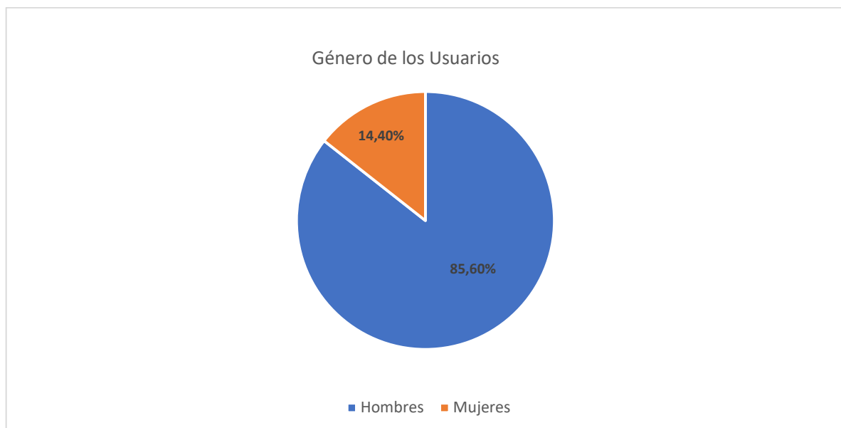
Gráfico 1. Género de los Usuarios

Según esta memoria a inicios de este año 2021 se han tratado a través del programa a 723 diferentes personas en la calle. Respecto al género la muestra indicaba como 619 eran hombres mientras que el 104 restante eran mujeres permitiéndonos observar como el sinhogarismo en la capital almeriense es un proceso masculinizado .