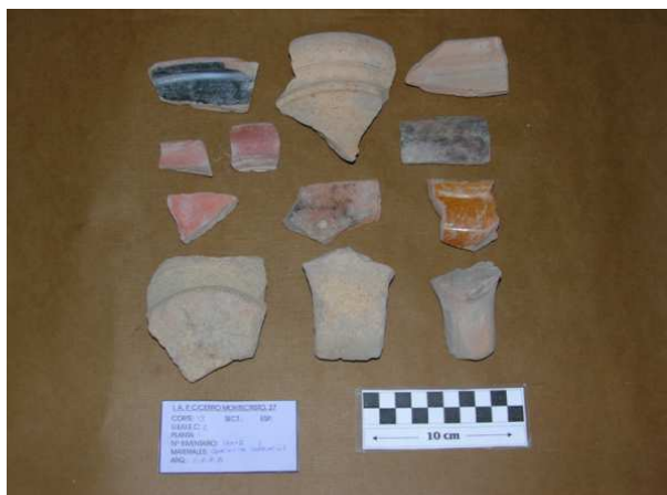
Corte 13, U.E. 2, N° 13012