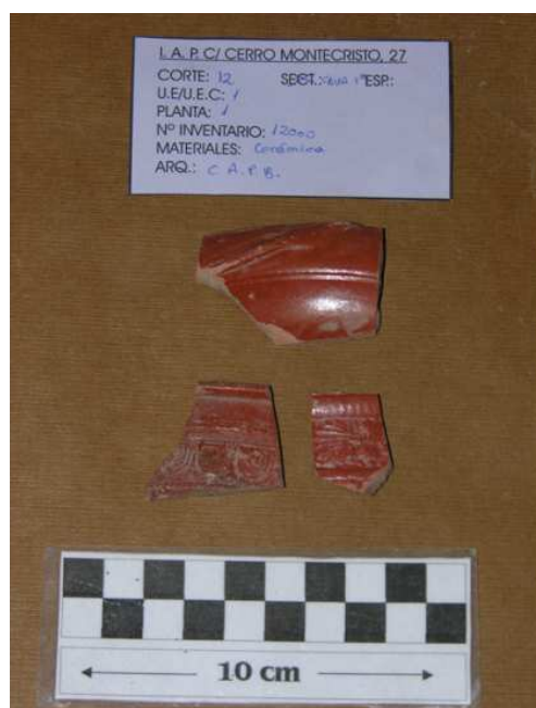
Corte 12, U.E. 1, N° 12000

De esta misma unidad sedimentaria son los fragmentos de hierro encontrados, uno de ellos es una especie de argolla y el otro es un rectángulo macizo de tamaño considerable y vértices achatados.