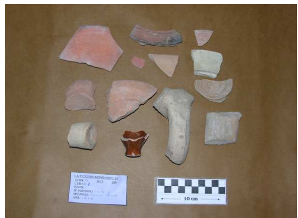
Corte 13, U.E. 2, N° 13017.