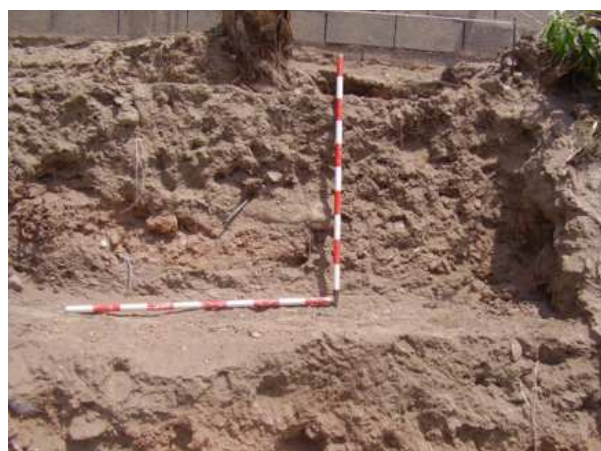
Vista general del sondeo 12.