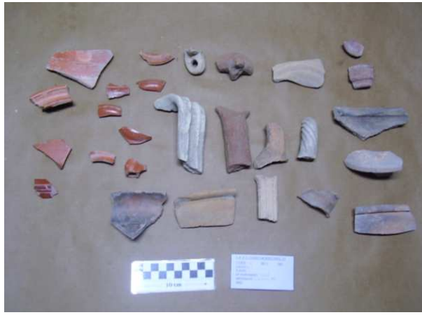
Corte 13, U.E. 1, N° 13004.