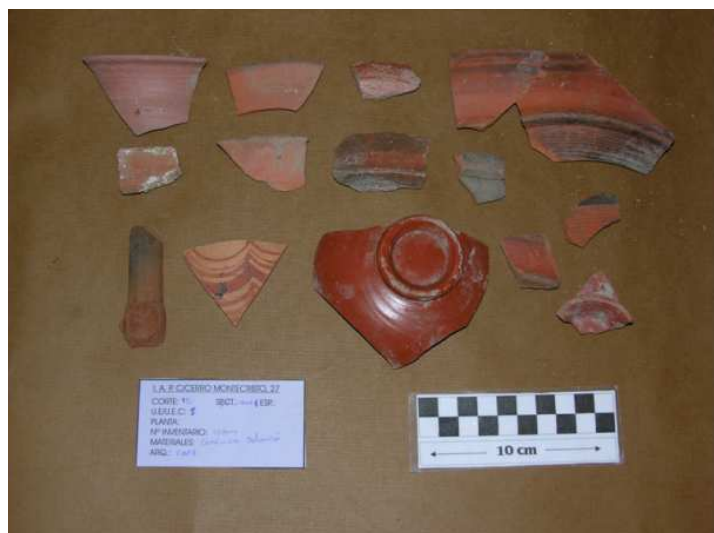
Corte 12, U.E. 1, N° 12004