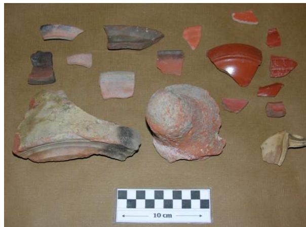
Cerámica de seguimiento