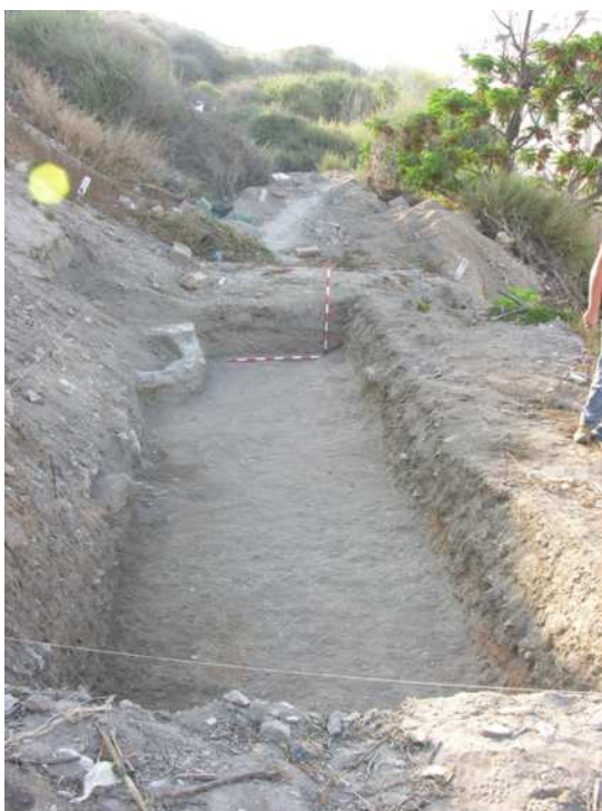
Vista general del sondeo 13.

Al comienzo de la excavación del corte encontramos una tierra de color marrón claro (U.E.1) con abundantes escombros y basuras que se mezclan con material cerámico protohistórico y de época romana. Esta unidad estratigráfica coincide con la U.E. 1 del sondeo 12 compartiendo iguales características.