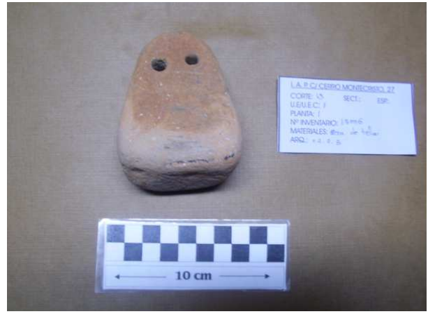
U.E 1, corte 13 Pesa de telar. N°13006.