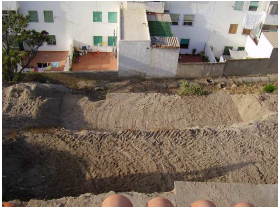
Vista general tras el seguimiento mecánico.