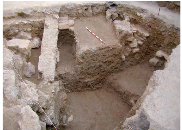
Lámina V. Sondeo 5. Vista general.

Al Este de este pequeño muro tenemos dos niveles de pavimento (U.E.C. 15, U.E.C. 6), realizados en mortero de cal y que aparecen rotos por la cimentación del muro (U.E.C. 7).