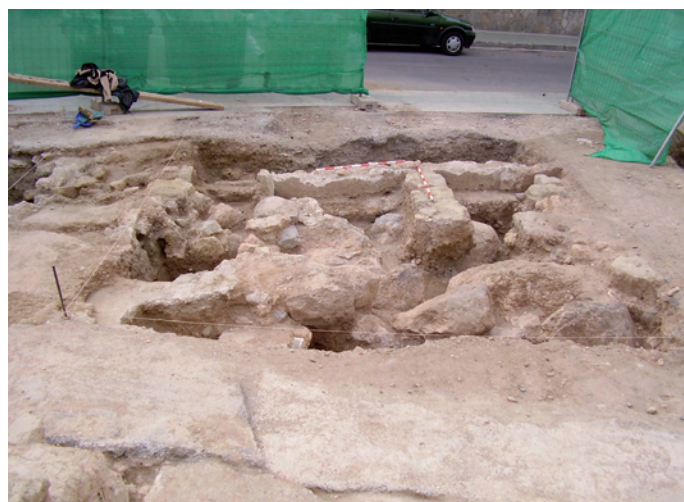
Lámina III. Sondeo 3. Vista general.

Se documenta un muro de tapial (U.E.C. 12) con dirección Este-Oeste, que tiene continuidad en el sondeo 1, y que se adosa a una estructura de sillares y tierra (U.E.C. 9) que forma parte de una entrada y un pasillo que conducen a la/s vivienda de los sondeos 4 y 6. Ese pasillo conserva restos de pavimento, que aparece decorado en rojo (U.E.C 21), que tendría continuidad hacia el Norte (U.E.C. 6) Junto a esta entrada, en la parte Sureste del sondeo nos aparece un pozo (U.E.C. 18) realizado en piedra seca de similares características a uno de los del sondeo 1 y al del sondeo 5. Tanto en el extremo Sur como en el Norte del sondeo 3 aparecen los niveles estériles de gravas que coinciden con los del sondeo 1, 2 y 5.