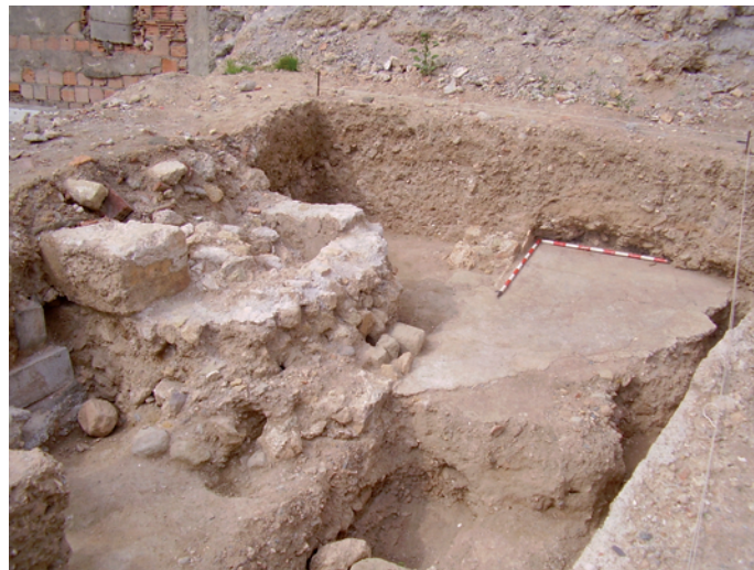
Lámina II. Sondeo 2. Vista general.

tación de los edificios de época contemporánea. De Oeste a Este nos aparece un muro (U.E.C. 6) de piedra y mortero que conserva parte del enfoscado; adosado a éste hay un pavimento (U.E.C. 7) realizado con mortero de cal y en el que se aprecian las marcas de la puerta de entrada a ese espacio habitacional. Al Norte, coincidiendo con el límite del sondeo aparece un muro de tapial (U.E.C. 3), para cuya construcción se destruyó el pavimento anterior.