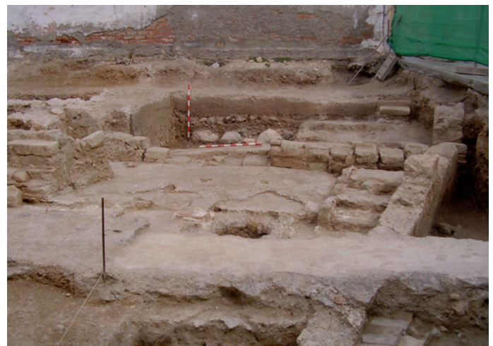
Lámina VI. Sondeo 6. Vista general.

En el sondeo 6 encontramos los restos de una vivienda de época medieval (andalusí) que probablemente haya sido reutilizada en época moderna, ya que aparecen en los primeros estratos material que puede ser cristiano. En la mitad Sur del sondeo tenemos lo que pudo ser el patio de la vivienda, bajo una tierra rojiza (U.E. 4) igual que la de encima de los pavimentos de los sondeos 4 y 5, con dos niveles de suelo (U.E.C. 20 y 21) realizados en mortero de cal, un pozo de muy buena factura (U.E.C. 19) similar a uno de los del sondeo 1. Hacia la mitad del sondeo documentamos un muro de sillares de arenisca (U.E.C.13) que cruza todo el sondeo de Oeste a Este, con una entrada hacia el patio. Hacia el extremo Norte tenemos un muro de tapial con dirección Sureste-Noroeste, para cuya construcción se rompería un nivel de pavimento asociado a la U.E.C.13 (U.E.C. 14,15). Este sondeo ha sufrido dos ampliaciones: una por el Este, en la que se le ha añadido el testigo que linda con el sondeo 4; y otra por el Sur en la se han añadido unos 0,40 m. hasta llegar a la cimentación de cemento de época contemporánea.