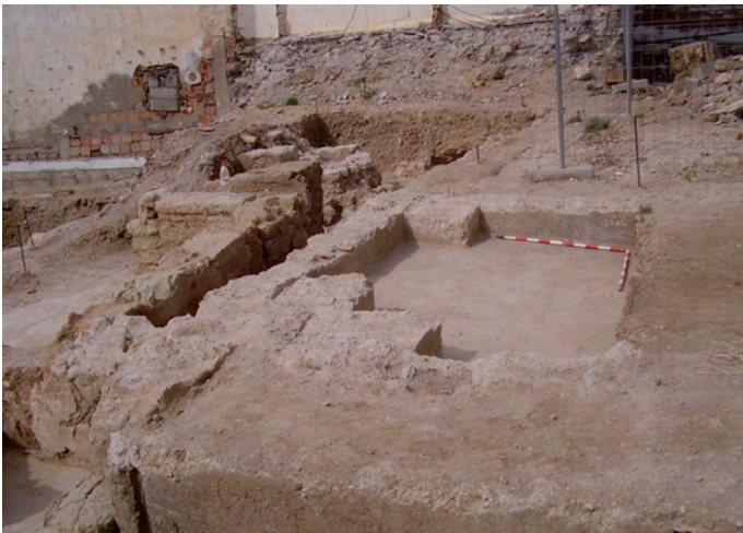
Lámina IV. Sondeo 4. Vista general.

En la mitad Sur aparece un espacio de habitación delimitado al Norte, al Este y al Oeste por muros de sillares de arenisca y ladrillo (U.E.C. 7), en la parte Sur han sido destruidos por la cimentación de hormigón de los edificios de época contemporánea. En estos muros aparecen restos de enlucido blanco y estuco rojo. En el espacio que delimitan encontramos dos niveles de suelo (U.E.C.16 y U.E.C. 17) realizados en mortero de cal, el primero de los dos con restos de decoración en rojo. Adosada al muro de sillares y ladrillo, en la parte Sureste aparece una escalera de sillares de arenisca y un pavimento de mortero de cal que tiene continuidad en el sondeo 6.