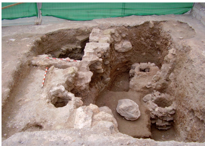
Lámina I. Sondeo 1. Vista general.

El sondeo 1 presenta varios tipos de estructuras: dos muros de tapial (U.E.C. 12 y 13) que delimitan un espacio hacia el Sureste donde se sitúa una estructura hidráulica (U.E.C. 26) fabricado en sillares de caliza y que culmina su cubierta con una falsa cúpula. Hacia el norte tenemos un pozo (U.E.C. 29), construido en piedra seca. En el otro extremo del sondeo tenemos otras dos estructuras de carácter hidráulico (pozos) y otra estructura cuya funcionalidad no hemos identificado. Una de ellas es un pozo excavado en la tierra sin material de construcción y en el que se han encontrado abundantes restos cerámicos y de fauna (U.E.C. 30). La otra, un pozo (U.E.C. 22), distinto a los anteriores porque el sillarejo aparece trabado con mortero de cal.