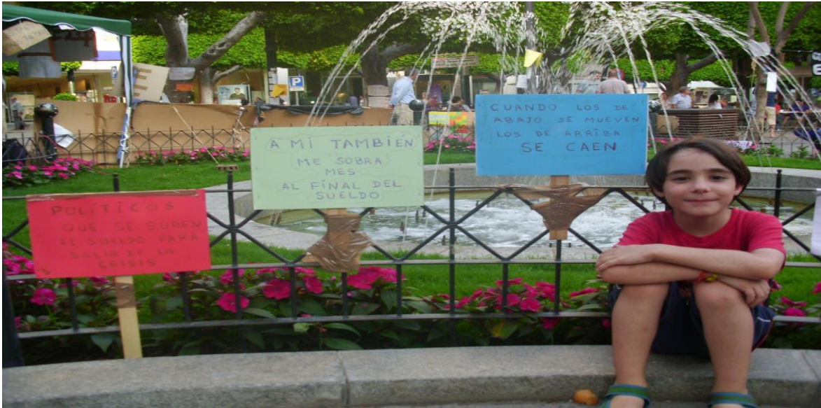
Imagen 2 35 : observamos más elementos de la Plaza Juan Casinello. Aquí destacamos tres carteles que rodeaban la acampada junto con un niño de corta edad a modo de reivindicación por el futuro incierto causado por la crisis.

Imagen 1 34 : Algunos indignados frente a un tenderete verde están cocinando gracias a la electricidad proporcionada. Se observa, además, un cartel rosa en el cual se lee: “gracias por las donaciones”.