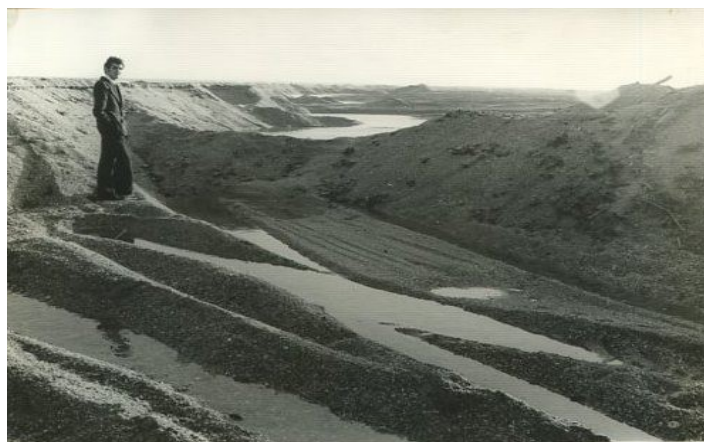
Panorama que presentaban el medio sedimentario (AHPAL sección 5524, Signatura Turismo e Información)

En el actual Paraje Natural de Punta Entinas- Sabinar, se extrajeron más de 5.000.000 m 3 , lo que supuso la destrucción de 262 Hectáreas de dunas.