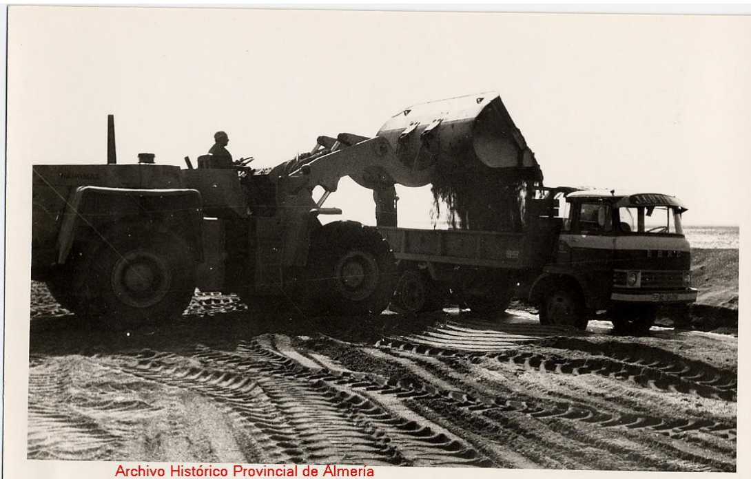
Archivo Histórico Provincial de Almería

En este impulso constructivo también han sido sacrificados muchos humedales que ya he nombrado anteriormente, a lo cual se traduce, con pagar un elevado precio ambiental merced a un crecimiento urbano que no se corresponde, en absoluto, con un incremento poblacional.