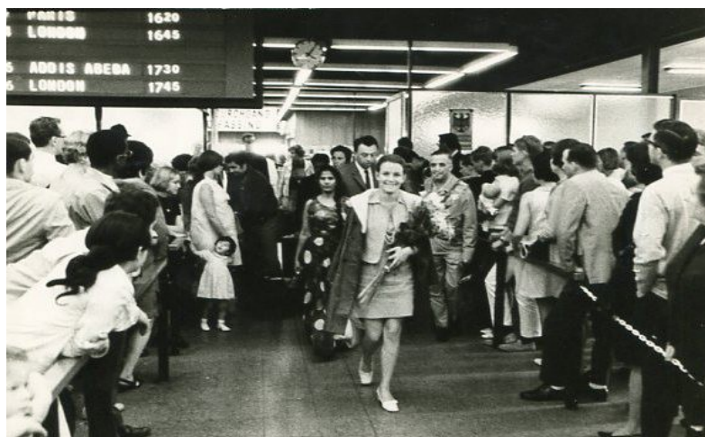
Imagen de la llegada de uno de los primeros vuelos con destino Almería.

A principios de los setenta a raíz de la construcción del aeropuerto en Almería fue cuando Almería empezó a interesarse y moverse por y para el turismo, se pudo incluir la marca costa de Almería a los turoperadores con el resultado de que ellos ya empezaron a incluir a Almería en los paquetes turísticos, como se hacían en las diferentes partes de la costa mediterránea.