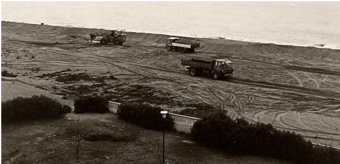
Uso de camiones y palas mecánicas para la extracción de áridos.

El choque de intereses se inicio cuando empezaron a usar palas mecánicas para la extracción de arenas, lo cual origino un deterioro excesivo y una extracción anárquica y masiva, ya que antes del boom del turismo, solo ponían alguna oposición hacia la extracción de arena algún particular pero nada importante