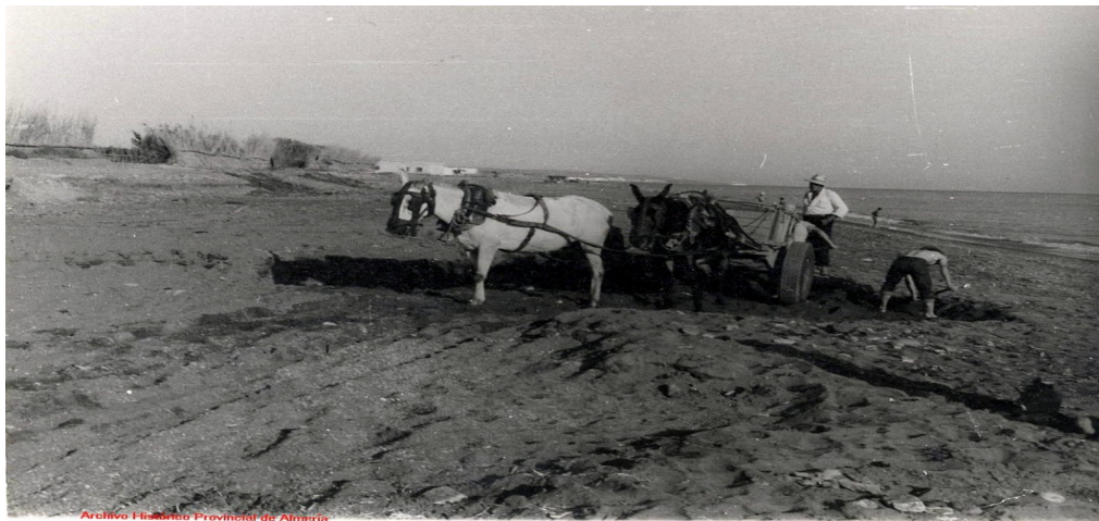
Imagen de un burro tirando de un carro lleno de arena.

Aquí el turismo no se entrometía, porque como comentare posteriormente no había turismo todavía en Almería, y la tierra era solo para la agricultura. (Cassinello, 2006)