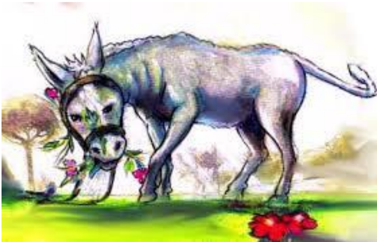
Imagen de Platero, recurso para la clase.