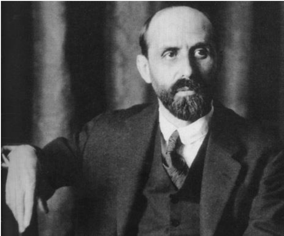
Imagen de J.R.J., recurso para la clase.