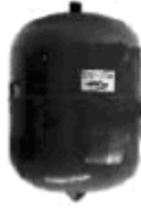
Ilustración 4. Vaso de expansión.