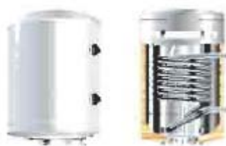
Ilustración 1. Acumulador en el que se observa el intercambiador tubular.

Para el caso del intercambiador incorporado al acumulador, la relación entre la superficie útil de intercambio y la superficie total de captación no será inferior a 0,15. En nuestro caso la superficie útil de intercambio es de 0,81 m 2 y la superficie colectora es de 1,99 m 2 , cumpliéndose por tanto tal requerimiento.