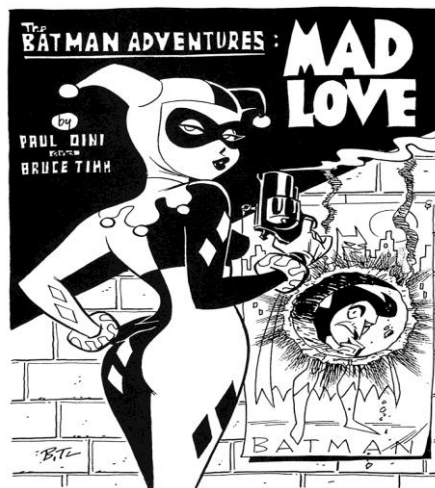
Fig. I. Portada alternativa de Mad Love (febrero 1994)

Mad Love desvela que Batman lleva tiempo investigando sobre la eficaz nueva edecán del delincuente, compartiéndose por primera vez con el público sus resultados. Se descubría en el número que su nombre real completo era Harleen Quinzel, quien había sido una destacada gimnasta amateur hasta el punto de lograr una beca para la universidad de Gotham. Sus años en el campus reflejaron que sus metas iban más allá de las hazañas deportivas, doctorándose en Psicología. No obstante, de forma sutil se ve en las viñetas de flashback que no dudó en aprovecharse de su atractivo para lograr la máxima calificación por su tesis.