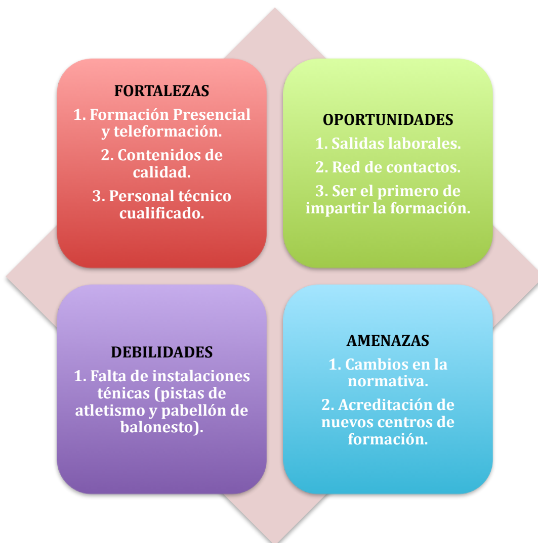
Figura 2. Plan DAFO.

Siguiendo con los autores Navas y Guerras (1996), vamos a presentar un análisis DAFO (Debilidades, Amenazas, Fortalezas y Oportunidades). Utilizamos este modelo, ya que, nos permite identificar de una forma rápida los factores internos dentro de la empresa, como las debilidades y fortalezas, y los factores externos que dependen del entorno donde operamos, como las amenazas y oportunidades que puede tener la empresa. Es una herramienta sencilla, fácil de utilizar y nos ayuda a tomar decisiones. Así que nuestro análisis del plan DAFO es el siguiente: