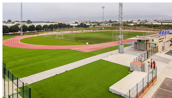
Pista de atletismo de la UAL