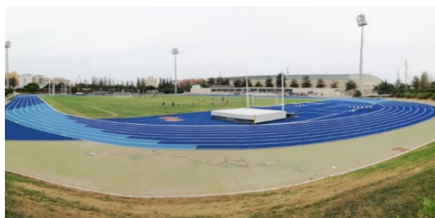
Pista de atletismo Patronato Municipal Almería