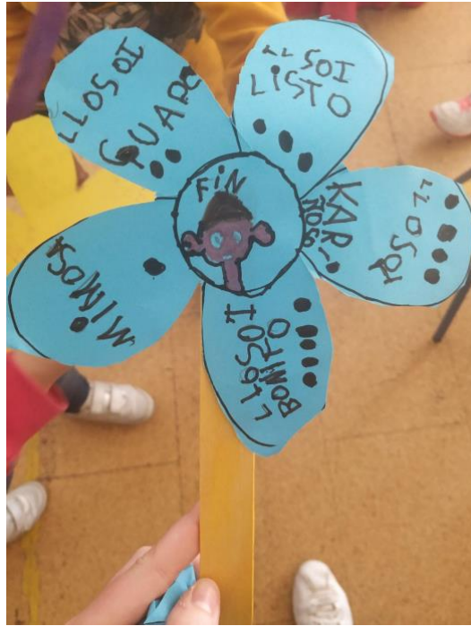
➤ Anexo III: Marioneta de la exploradora "Amanda"