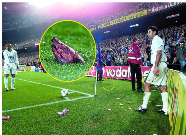
Figura 11. Lanzamiento de la cabeza de un cochinillo hacia Figo en su vuelta al Camp Nou en el año 2002 13

El comienzo de siglo traerá nuevos retos al club, con momentos muy difíciles que tendrá que superar. El primero, la marcha de uno de sus mejores jugadores, Luis Figo, al eterno rival. Dos años después de su fichaje, en uno de sus retornos al Camp Nou , cada vez que se disponía a lanzar un saque de esquina comenzaba una lluvia de objetos, con la fatídica anécdota del lanzamiento de una cabeza de cochinillo, momento en el que los antidisturbios tuvieron que intervenir y suspender el partido por unos minutos (Fig. 11).