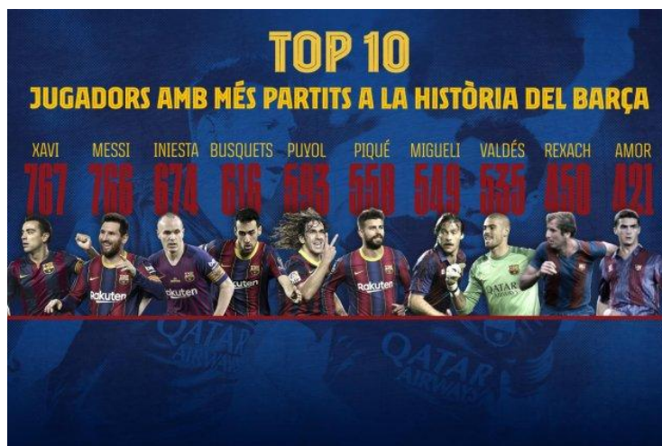
Figura 16. Jugadores con más partidos en la historia del club (Actualizado marzo de 2021) 17

Los tres máximos goleadores históricos son: Leo Messi, 738 goles en 914 partidos, César Rodríguez, 230 goles en 350 partidos, y Luis Suárez, 198 goles en 283 partidos.