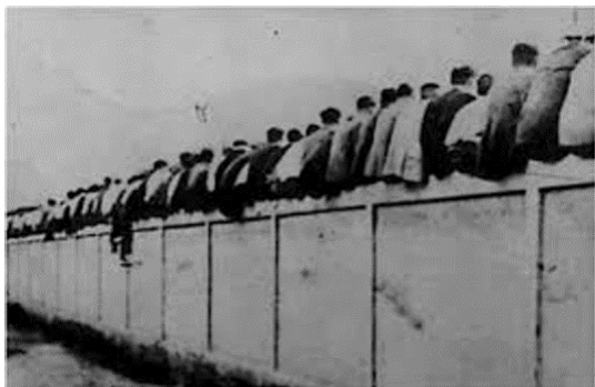
Figura 4. Campo de la Calle Industria 6

“Nuestro pueblo ha hecho suyo el Barcelona y el Barcelona se ha hecho el club de todos. Su fama mundial ha llenado de orgullo a Cataluña, esta tierra adorable, amante de todas las luchas, que las luchas, cuando son nobles, fortalecen y elevan” (Sobrequés, 2015).