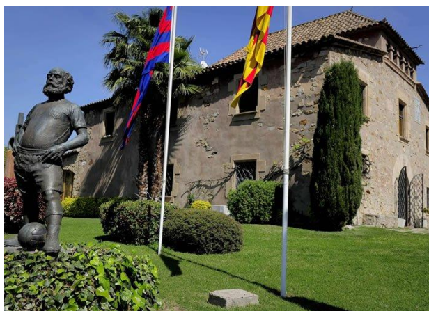
Figura 18. Antigua Masía 19

El club cuenta con una cantera de jugadores y jugadoras que se forman bajo el estilo de juego, la filosofía y los valores del club, cuya máxima expresión se encuentra en la llamada La Masía. La actual Masía, inaugurada en octubre de 2011, cuenta con unas instalaciones mucho más modernas adaptadas a las necesidades del club, con un total de 6.000 metros cuadrados de superficie, con capacidad para acoger a 83 deportistas y que se encuentra situada en la Ciudad Deportiva Joan Gamper ( Sant Joan Despí , Barcelona). Todo esto sin olvidar la esencia de la antigua Masía (Fig. 18), que estaba y sigue estando en las inmediaciones del estadio. La antigua Masía comenzó de la mano del presidente Núñez, que en 1979 decidió utilizar esta edificación de 1702 como residencia para los deportistas que vivían fuera de Barcelona y que estuvo en uso desde 1979 a 2011.