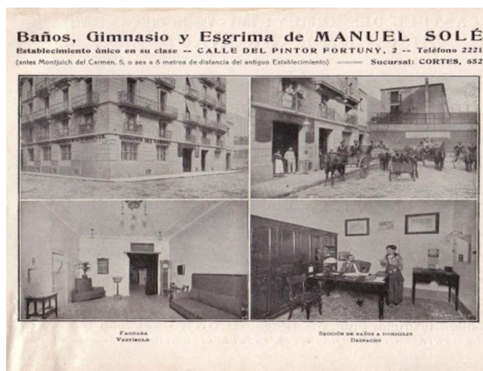
Figura 3. Gimnasio Solé, lugar de la reunión en la que el FCB fue constituido 5