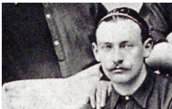
Figura 1. Hans Gamper en su época de jugador 3

Hans Max Gamper Haessig (Fig. 1), que nació el 22 de septiembre de 1877 en Winterthur (Suiza), dedicó toda su vida al deporte, destacando en varios de ellos, aunque especialmente como el mejor delantero del FC Excelsior , capitán del FC Basilea y fundador del FC Zurich .