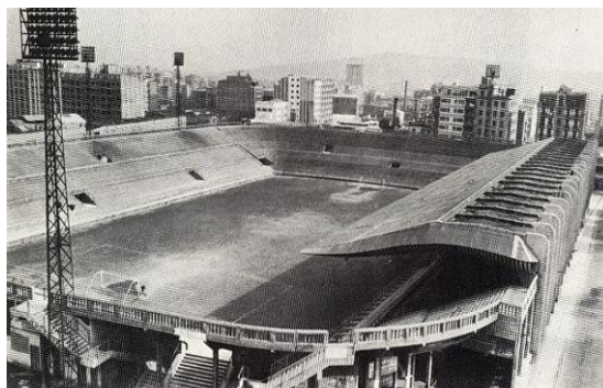
Figura 5. Camp de Les Corts 7

La segunda mitad de los años 20 estuvo marcada por la Dictadura de Miguel Primo de Rivera (1923-1930), régimen que puso freno al catalanismo del club. Un ejemplo de ello fue el cierre del estadio en 1925 durante seis meses por pitidos y abucheos al himno español, frente a los aplausos al himno inglés. Comenzó aquí un periodo de represión en el que Gamper tuvo que dejar la presidencia, desvincularse totalmente del club y marchar al exilio a Suiza un tiempo. Tildado de fundador extranjero separatista y defensor del catalanismo y agravado por su adscripción al cristianismo protestante en una zona profundamente católica. En palabras de Santacana: “ solo le faltó ser acusado de ser comunista, que no lo era ” (2018). Los socios siguieron pagando la cuota y realizando donativos, mientras que los jugadores mostraron su fidelidad no abandonando el club en las difíciles circunstancias descritas.