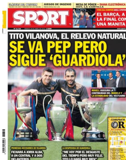
Figura 13. Portada del Diario Sport : Tito y Pep con el Triplete 14

Parecía que todo iba bien, hasta que en diciembre Tito recayó de un cáncer del que fue operado la temporada anterior. Tito tuvo que irse a EEUU a realizar un nuevo tratamiento y el equipo siguió jugando sin su líder. Jordi Roura, hasta ese momento el segundo entrenador, se puso al mando. Finalmente, Tito volvió en abril y pudieron ganar en su honor, el que sería el único título de la temporada, la Liga, quedando primeros con 100 puntos. Desde entonces, a la temporada 2012-2013 se le conoce como la Liga de Tito o la Liga de los 100 puntos (Sobrequés, 2015).