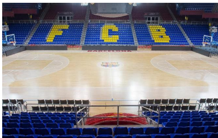
Figura 17. Palau Blaugrana 18

En la actualidad, sin contar las secciones amateurs, el club cuenta con cinco secciones profesionales en la que cada año luchan por ganar todos los títulos, jugando sus partidos cuatro de ellas, baloncesto, balonmano, hockey patines y fútbol sala, en el Palau Blaugrana (Fig. 17).