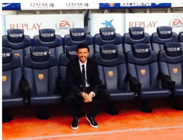
Figura 15. Luis Enrique el día de su presentación como entrenador 16