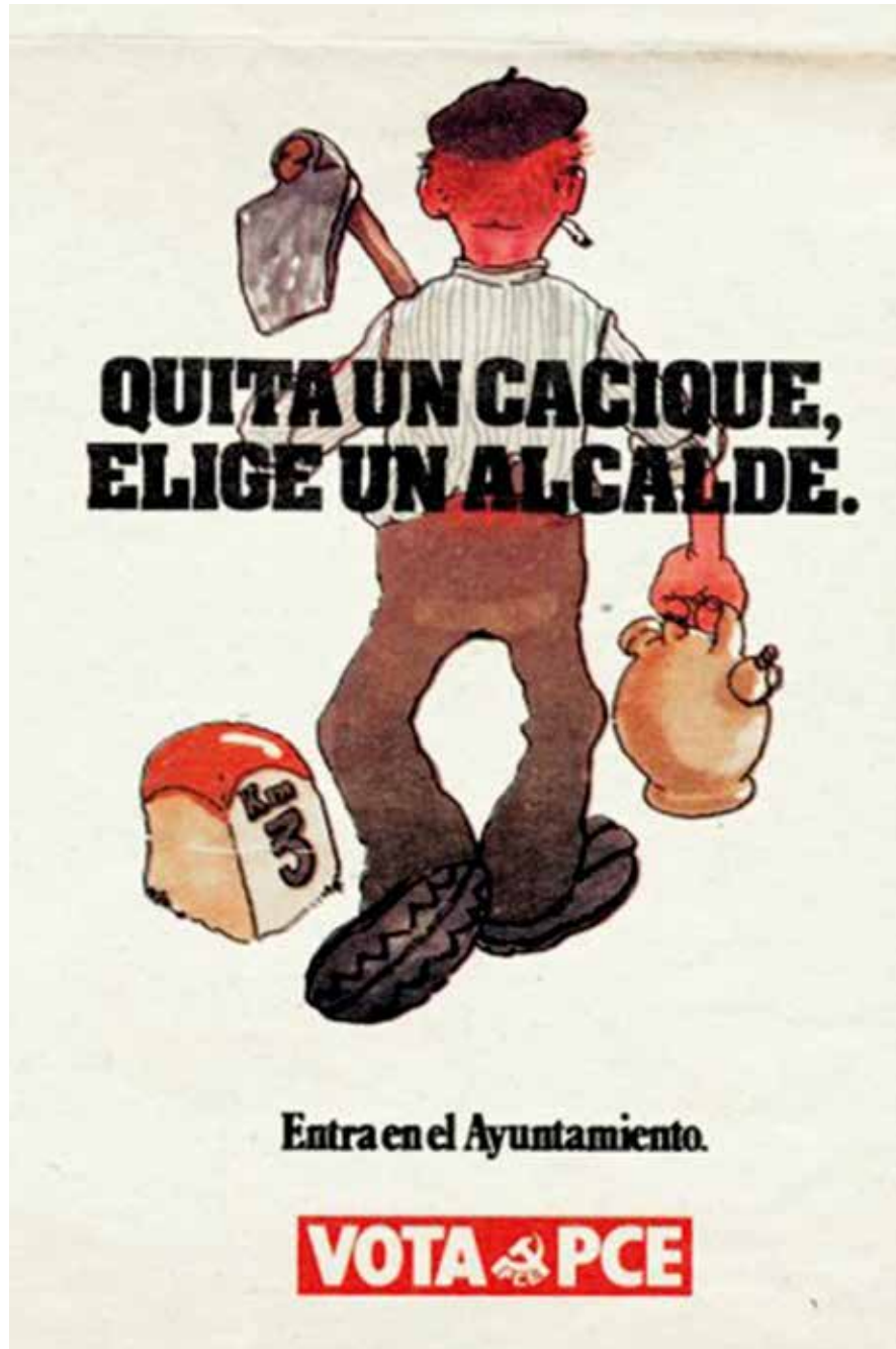
Cartel del PCE para las elecciones municipales de 1979.

tos recibidos. Su hegemonía en las zonas rurales permitió a los centristas obtener el mayor número de actas de concejal y ocupar la presidencia de las diputaciones provinciales de Almería, Córdoba, Granada y Huelva. Pese a ello, Andalucía fue una de las pocas regiones donde el porcentaje de puestos logrados por los socialistas en los consistorios fue superior que el de los sufragios, con un predominio de la formación encabezada por el sevillano Felipe González en las áreas urbanas y con un nivel más alto de desarrollo socioeconómico.