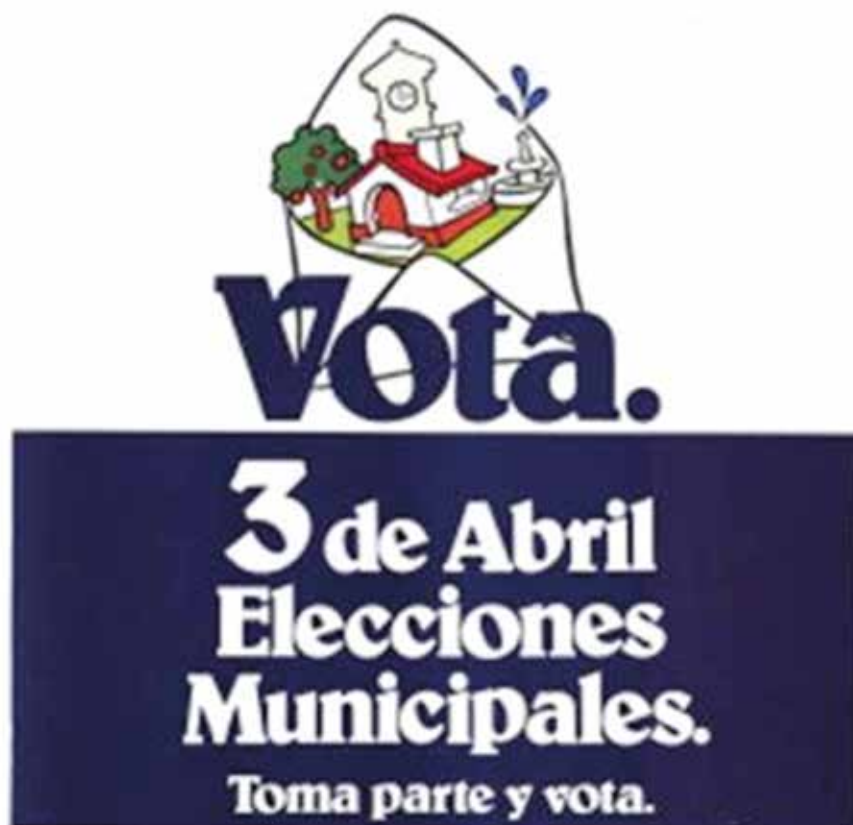
Cartel animando a la participación en las elecciones municipales de 1979.