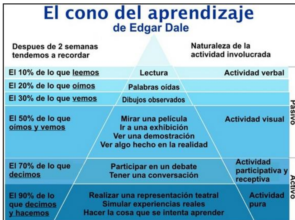
IMAGEN 2: Cono aprendizaje Edgar Dale

La idea que la sociedad tiene de los centros educativos está asociada al elemento correccional, creada para obligar al estudio y al trabajo y castigar las trasgresiones. Claro está que con esta idea de educación, son muchos los que se sorprenden (incluidos los alumnos) cuando los centros educativos toman parte en las actividades lúdicas. Pero a pesar de que el potencial del ABJ sigue estando infravalorado, creo que puede desempeñar un papel esencial en el proceso de enseñanza–aprendizaje y de maduración del individuo. No solo los humanos aprendemos a través del juego, esta metodología de aprendizaje es bastante común en la naturaleza (los felinos aprenden a cazar mediante juegos, por ejemplo).