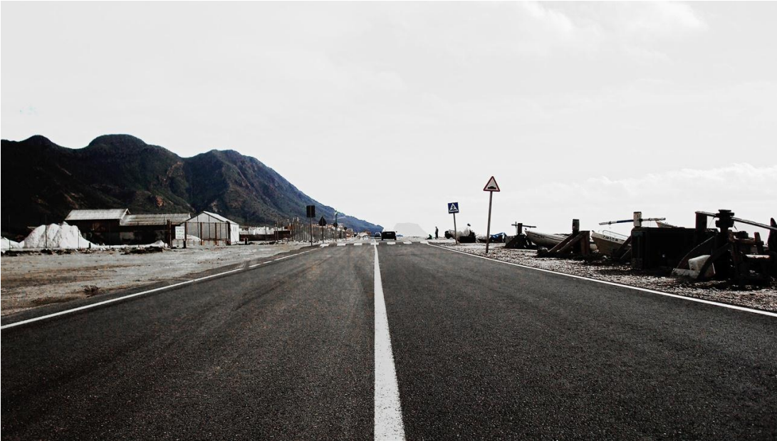
Parada 3. Salinas de Cabo de Gata, 3 de enero de 2010, 3.19 p.m.