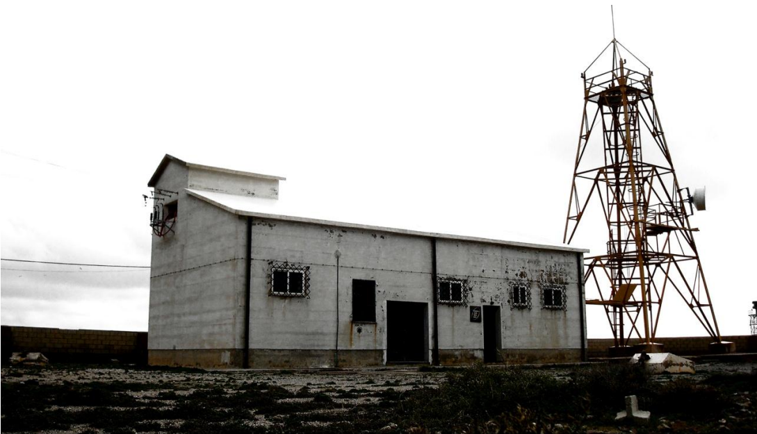
Parada 4. El faro, Punta Baja y Vela Blanca, 3 de enero de 2010, 4.03 p.m.