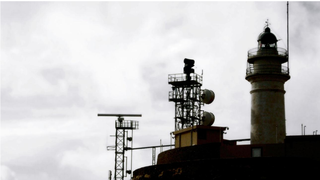
Parada 4. El faro, Punta Baja y Vela Blanca, 3 de enero de 2010, 3.37 p.m.