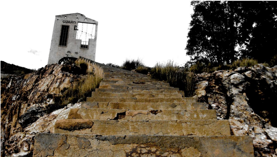
Parada 8. Rodalquilar, 4 de enero de 2010, 3.58 p.m.

Hoy en día, la deriva y la entropía se conjugan en una práctica subcultural que contribuye al estatus democrático de la interpretación del entorno: la exploración urbana.