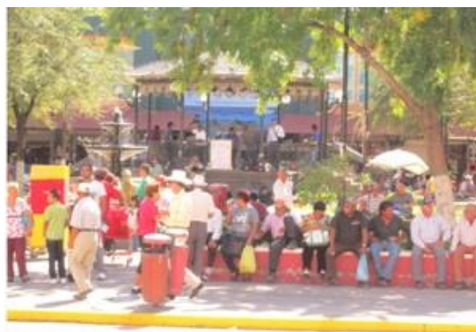
Plaza de Armas en el centro histórico Tomada el 9 de abril del 2013

parte de las tácticas que emplean los grupos de acción colectiva. Los grupos de acción colectiva emprenden acciones que invitan a compartir el espacio de lo público y, a su vez, los actores urbanos acuden por una necesidad de uso generada a partir del consumo.