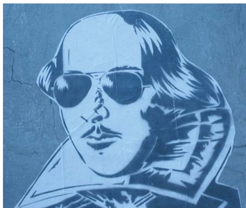
William Shakespeare with Aviator Sunglasses . Graffiti anónimo en Nueva York. 2008.

Queda patente que, a la vez que persiste un interés generalizado en estudios literarios y en el ámbito artístico por recuperar la figura de Shakespeare, algunos sectores han ido adquiriendo cierta consciencia de la posibilidad de reactivar la imagen de Shakespeare, más allá de cuál sea su “original”, sin aspirar, necesariamente, a retratarlo (o leerlo) al pie de la letra . Serigrafiar su retrato -y no necesariamente su retrato oficial, aunque sí uno que resulte reconocible-, colorearlo con spray sobre un muro, ponerle las gafas de sol de moda o vestirlo como una estrella de Hollywood son gestos habituales de “rematerialización”: