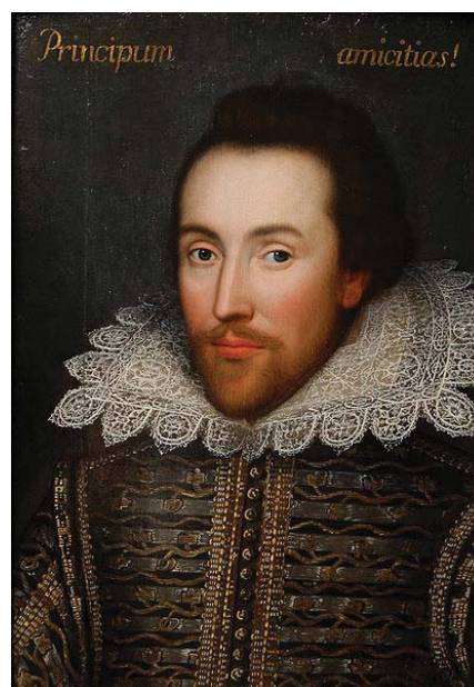
Cobbe Portrait. Artista desconocido. 1610.

Las razones esgrimidas por Stanley Wells no sólo obvian este hecho, sino que encuentran en él su apoyo fundamental. De acuerdo con Wells, lo novedoso del Retrato Cobbe es precisamente que descubre al público de Shakespeare “a man who was of high social status” (citado por Lacayo, Time 2009). Wells afirma no albergar dudas de que se trate del original, pues, en comparación con el Retrato de Sir Thomas Overbury, el de Shakespeare es “a much livelier painting, a much more alert face, a more intelligent and sympathetic face” (Lacayo 2009). A estas apreciaciones podemos sumar las de la institución que ha acogido la exposición del retrato, la Shakespeare Birthplace Trust; en la web donde anuncian el programa de la exposición, incluye unas palabras de Henry Woudhuysen quien apunta que Sir Thomas Overbury, “to our mind was not quite as good looking as Shakespeare” (Woudhuysen, 2009).