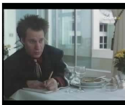
Shakespeare V. Jean-Luc Godard. 1987. Fuente: captura de fotograma de la película King Lear .