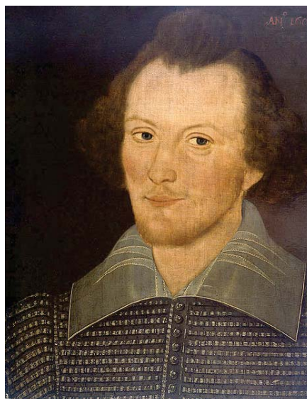
Sanders Portrait. 1603.

En la fecha en la que Reynolds y West publicaron Rematerializing Shakespeare (2005) el Retrato Sanders, había despertado una gran expectación, lo que sugería una suerte de interés generalizado por imaginar a la persona “Shakespeare” como icono cultural” (2005: 9). Es decir, la imagen de Shakespeare ha cobrado una entidad propia que se superpone a sus textos, suscitando en ocasiones incluso mayor interés que los mismos.