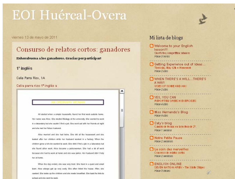
Figura 2.- Entrada de los ganadores del concurso de relatos de inglés y francés.