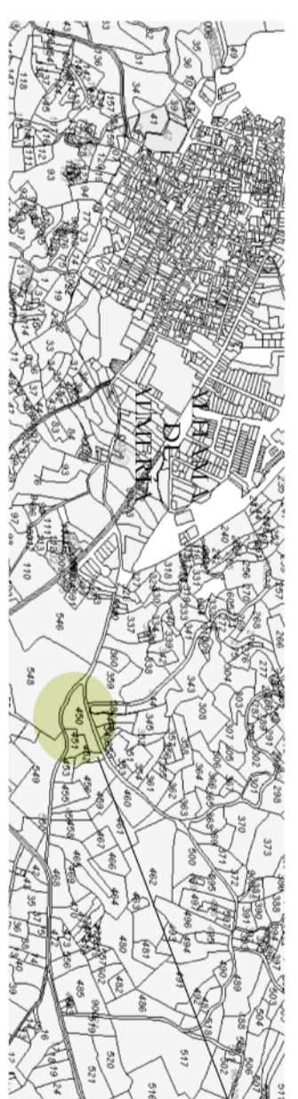
Ubicación de la parcela.

La parcela 450 se ubica en las proximidades de carretera A-348 al Este del Termino Municipal de Alhama, en el polígono 11 del paraje conocido como Malaguil, entre los caminos Paraje de Malaguil y camino de Trachta.