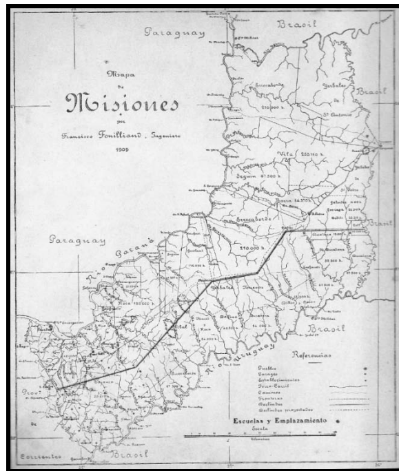
Figura 1. Consolidación de grandes latifundios en Misiones tras su federalización

Con la creación del Territorio Nacional de Misiones el 22 de diciembre de 1881 el Estado nacional pretendió lograr dos objetivos claros: dar solución al problema de límites que mantenía con la provincia de Corrientes por un lado e incorporar un nuevo espacio al dominio nacional por el otro. La conformación de latifundios que sobrevino a este proceso significó, empero, un obstáculo en la fundación de colonias agrícolas pues limitó la disponibilidad de tierras. La conformación de un frente extractivo 4 de madera nativa y yerba mate, insertaron a Misiones dentro de las relaciones extra regionales del capitalismo pampeano condicionando el inicio del proceso colonizador a la desaparición de los grandes latifundios (Hernández, 1887: 147).