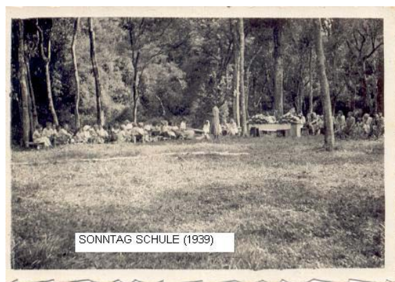
Figura 5. Reunión con almuerzo de inmigrantes suizos posterior a las prácticas de la Sonntag Schule (1939) en Línea Cuchilla.