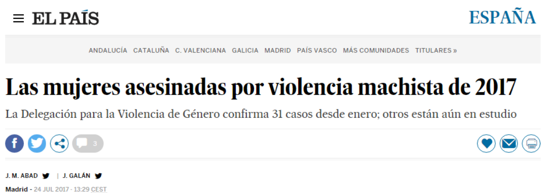
Ilustración 1. Ejemplo de noticia para utilizar en clase

Empezaríamos la dinámica a partir de la lectura de una noticia real que trate temas como igualdad, sexismo, violencia de género o machismo. Una vez que hayamos leído la noticia, daríamos comienzo con la metodología.