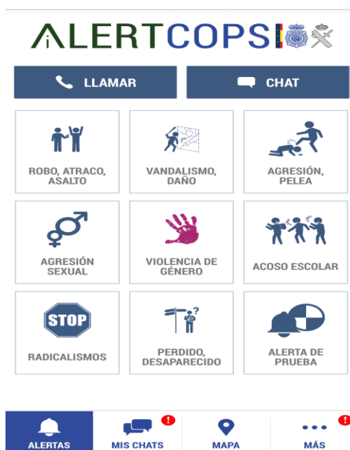
Ilustración 2. App "Alertcops"

Por último, aunque no se trate de una aplicación exclusivamente relacionada con la violencia de género me gustaría mencionar la app “Alertcops” (Ilustración 2) que es una aplicación que permite la comunicación con las Fuerzas y Cuerpos de Seguridad del Estado a través de alertas de seguridad sobre un acto delictivo que se esté sufriendo o del que se esté siendo testigo. Se puede notificar una nueva alerta, desde el menú principal, eligiendo el icono que mejor represente a la situación acontecida.