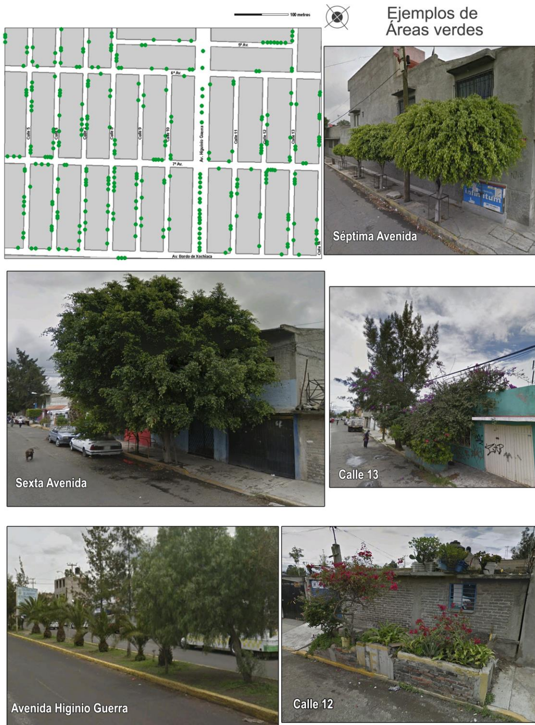
Figura 5. Áreas verdes. Fuente: elaboración propia a partir del mapa parcelario INEGI del Distrito Federal y Municipio de Nezahualcóyotl, 2001 (escala original 1:2000), e imágenes de Google Earth, 2009