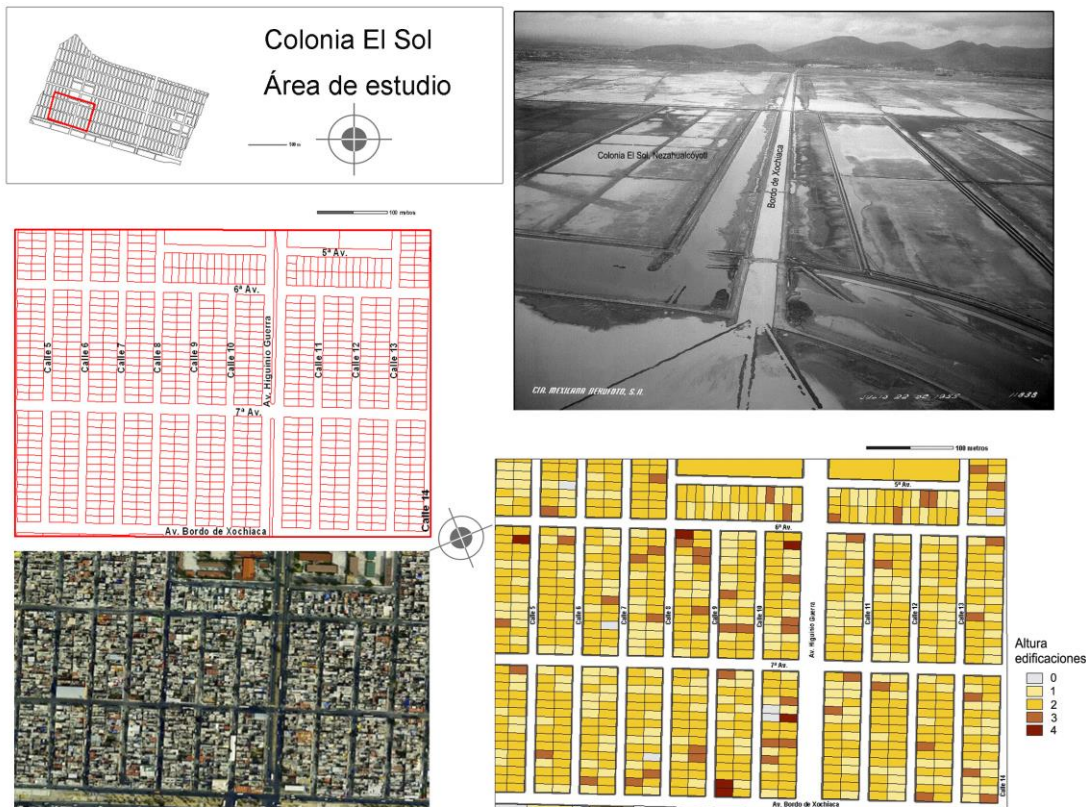
Figura 2. Área de estudio. Fuente: elaboración propia a partir del mapa parcelario INEGI del Distrito Federal y Municipio de Nezahualcóyotl, 2001 (escala original 1:2000). Fotografía: ICA/Aerofoto 1955, el Bordo de Xochiaca