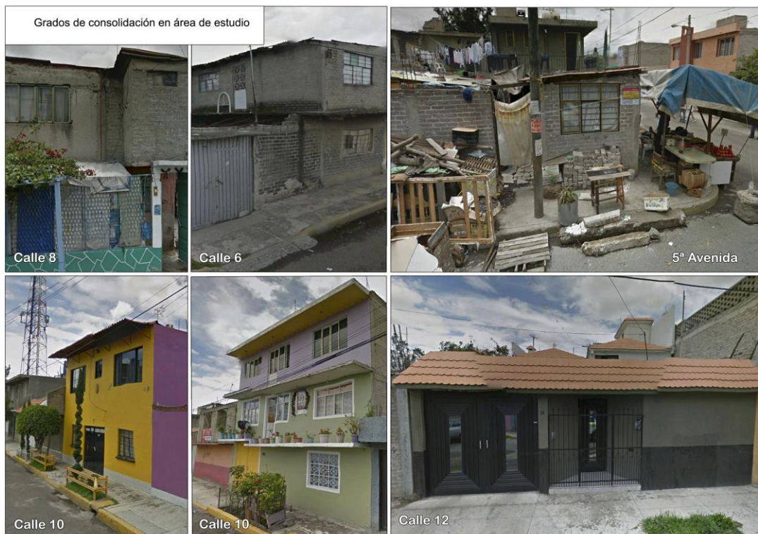
Figura 4. Fachadas y grados de consolidación.

La densidad poblacional es alta y cuenta con 800 parcelas, prácticamente todas habitadas, y solo 10 están libres de construcción y ocupan 1672 m 2 , el 0.6 % del espacio de parcelas libres privadas. Los lotes con edificaciones de una planta son 257, hasta 52 951.48 m 2 , el 21.2%. Las parcelas con edificaciones de 2 plantas ocupan 103 228.61 m 2 , es decir el 41.3 %. Las parcelas con edificios de 3 plantas alcanzan los 10 256 m 2 , y suponen el 4.1 %; y las parcelas con 4 plantas sólo llegan a los 1463.81 m 2 , el 0.5 % del área seleccionada.