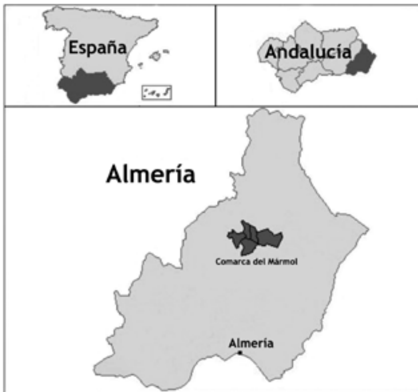
FIGURA 1 COMARCA DEL MÁRMOL. SITUACIÓN

aprovechamiento de los subproductos y a la fabricación de nuevos materiales sustitutivos del mármol, más acordes con las exigencias de la demanda y que, además, mejoran la sostenibilidad, tanto desde la perspectiva ambiental como de la actividad económica. La influencia de esta industria desborda los límites de la comarca y de la economía provincial, y juega un papel determinante en el sector español de la piedra ornamental, en el que España es uno de los líderes mundiales (Fundación Cajamar, 2010).